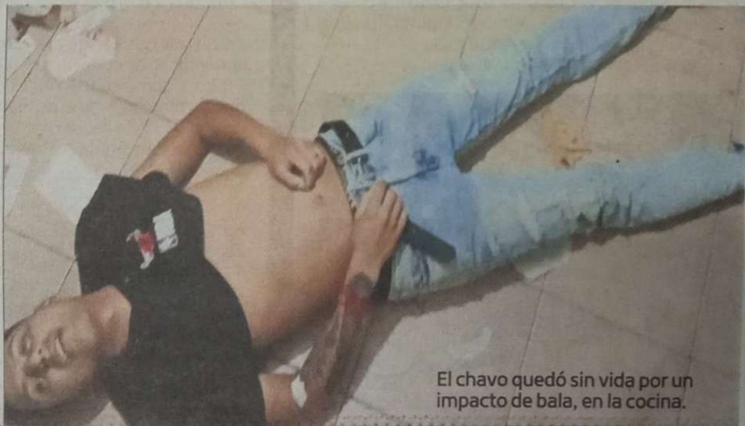
El chavo quedó sin vida por un impacto de bala, en la cocina.