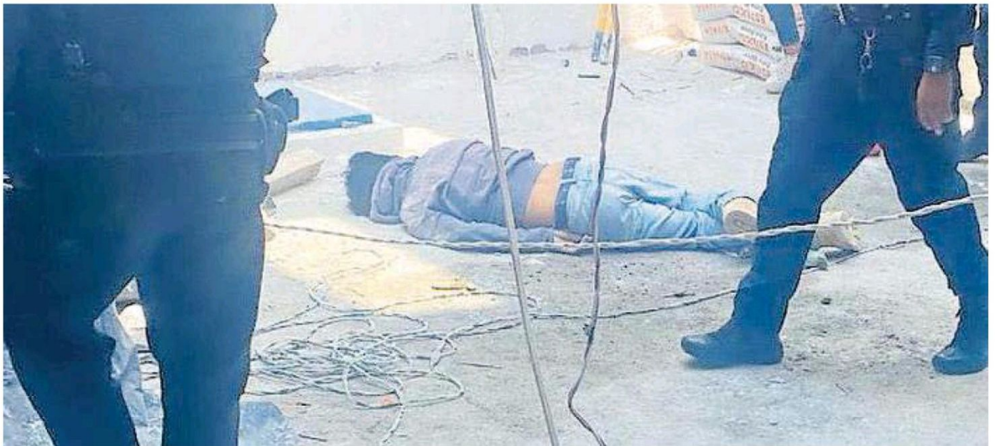
La obra , que se encuentra en avenida del Imán, interrumpió los festejos del Día de la Santa Cruz por el fallecimiento del albañil