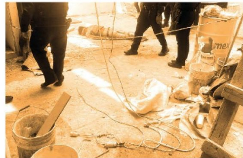
El golpe fue descomunal

metros fue la altura de la que cayó aproximadamente el hombre