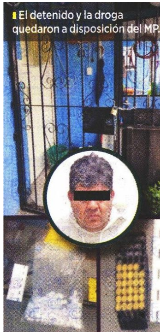
El detenido y la droga quedaron a disposición del MP.

Los agentes cumplieron una orden de cateo y encontraron 197 bolsas con piedra color blanco, 5 con polvo y 76 con marihuana, 5 cigarrillos de marihuana, además de 54 cartuchos útiles de calibre .22 milímetros.