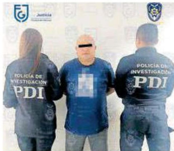
El hombre fue ingresado al Reclusorio Preventivo Varonil Oriente

Con estricto apego a la normatividad vigente y respeto a sus derechos humanos, el individuo fue trasladado e ingresado al Reclusorio Preventivo Varonil Oriente, donde quedó a disposición del juez de control que lo requería.