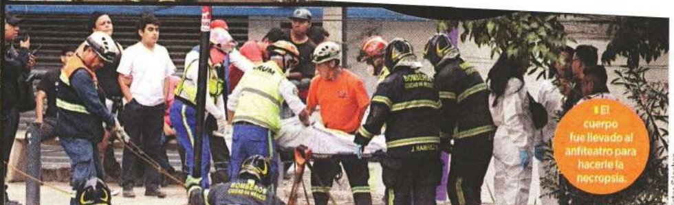
■ El cuerpo fue llevado al anfiteatro para hacerle la necropsia.