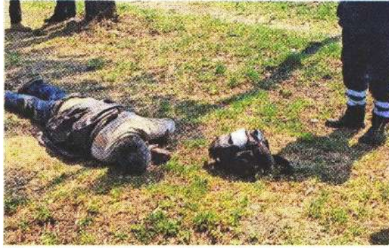
El hombre no fue reconocido en el lugar donde murió.