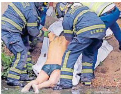
Se desvistió y se lanzó al canal en presunto estado de ebriedad