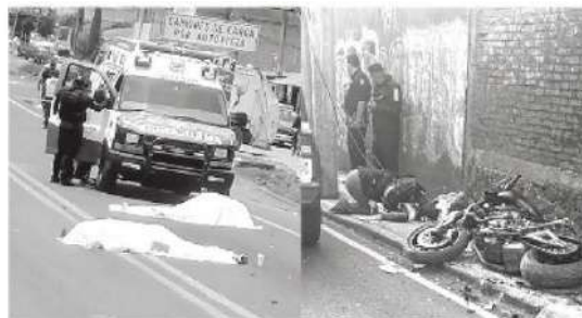
Prácticamente se despedazaron

Los cuerpos de los tres motociclistas quedaron despedazados