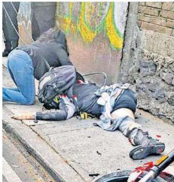
Roger "N" , de 43 años de edad, circulaba a alta velocidad a bordo de su motocicleta y se impacta brutalmente contra un poste

El accidente ocurrió durante las primeras horas de la mañana de este jueves sobre la calle Prolongación Centenario