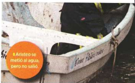
■ Aristeo se metió al agua, pero no salió.