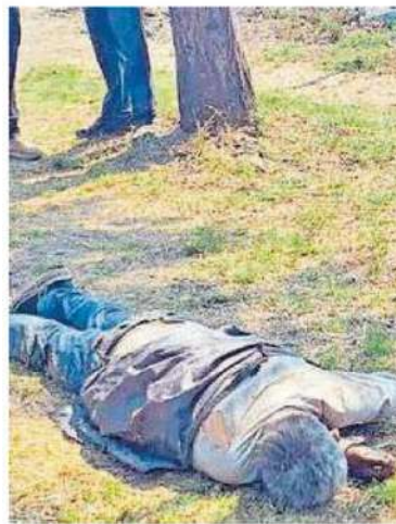
El hombre quedó tendido boca abajo en el pasto del camellón

Minutos más tarde, personal de la Fiscalía General de Justicia FGI de la Ciudad de México realizó las diligencias y el levantamiento del cadáver para trasladarlo a la coordinación territorial Iztapalapa 4 se espera que un médico forense de a conocer las causas de la muerte.