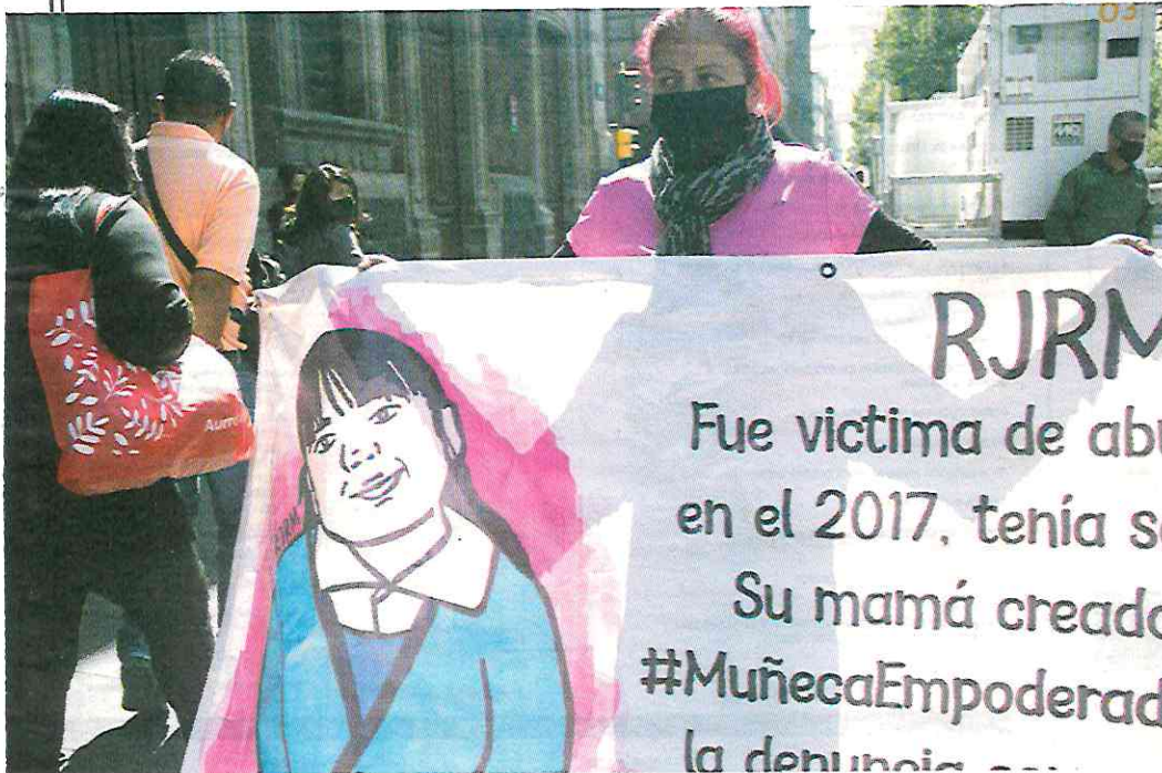
ACTIVISTA protesta contra la violencia de género en México, en el Zócalo capitalino, en noviembre de 2020.