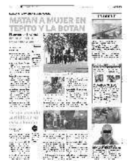
La línea de investigación conduce al Barrio Bravo