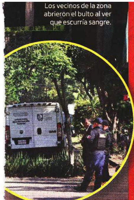
Los vecinos de la zona abrieron el bulto al ver que escurría sangre.