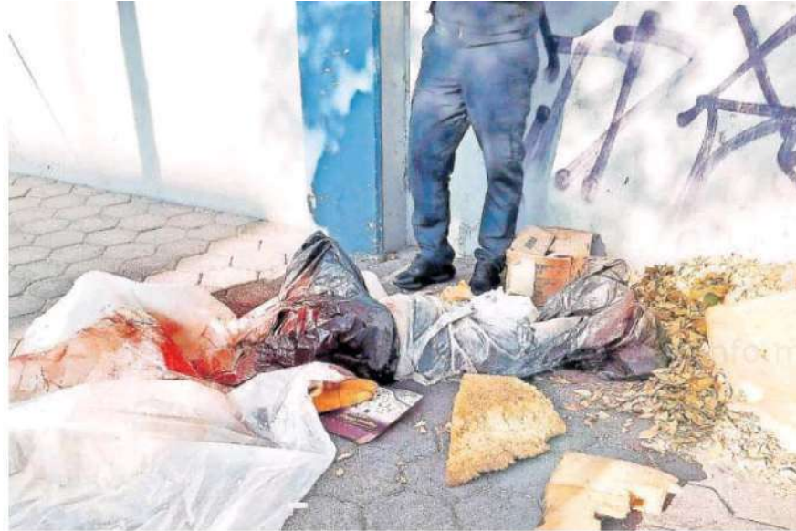
Se sabe que dicha mujer, quien hasta el momento permanece en calidad de desconocida, pudo haber sido privada de la vida en la colonia Morelos