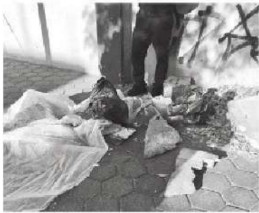
Así fue localizado el cadáver

Los investigadores analizan cámaras del C5 y otras privadas para tratar de dar con los responsables