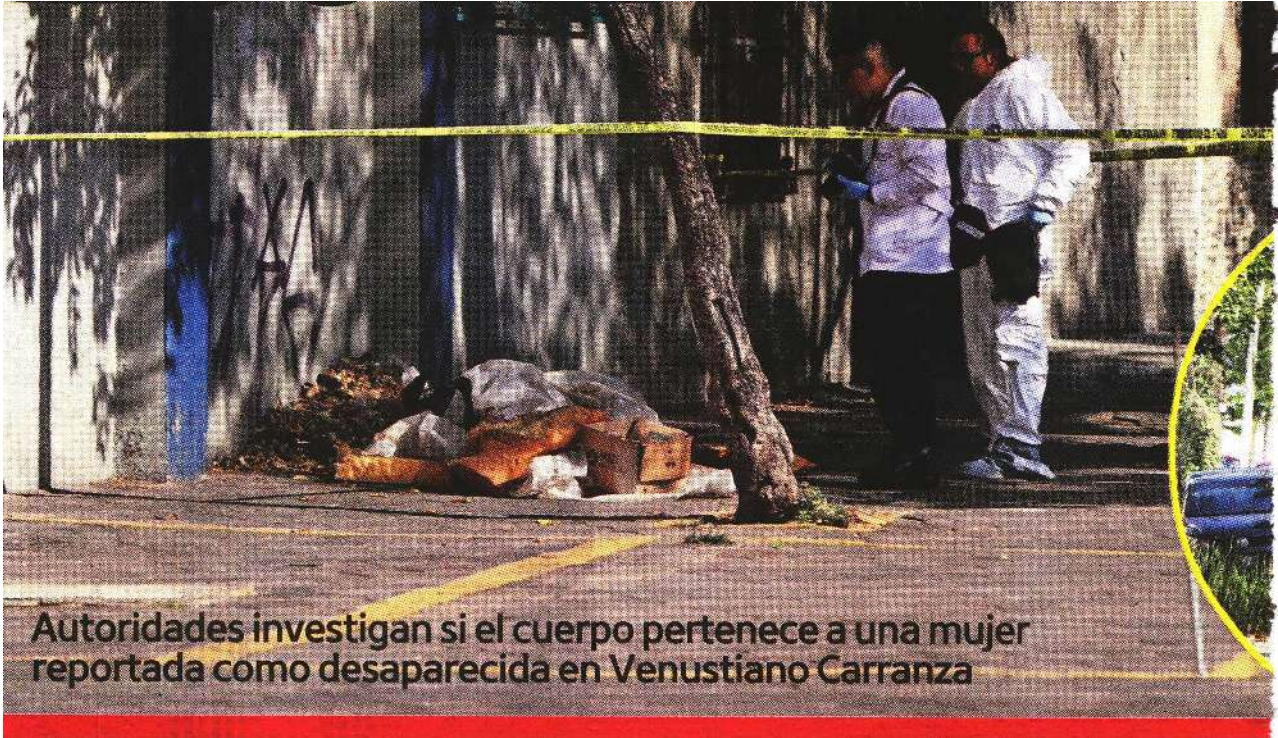
Autoridades investigan si el cuerpo pertenece a una mujer reportada como desaparecida en Venustiano Carranza