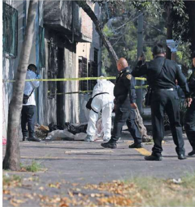
Los hechos ocurrieron sobre la calle de Vulcanización, a donde arribaron elementos de la Secretaría de Seguridad Ciudadana.