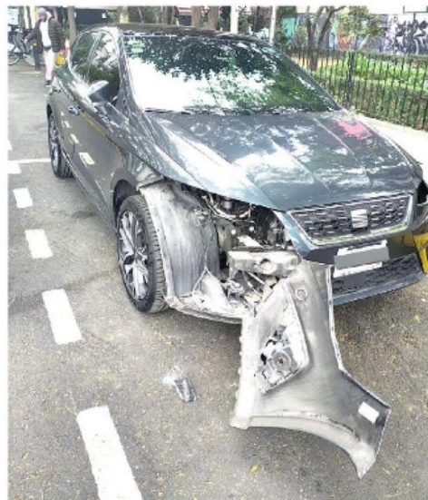
En lo que va de los últimos 4 años

Quien cometa el delito podría pasar 8 años en prisión