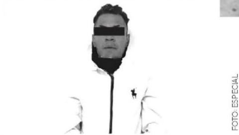
El sujeto la había amenazado de muerte

De acuerdo a las indagatorias, el detenido y otros miembros de Los Chopersitos venden droga en la colonia Desarrollo Urbano Quetzalcóatl.