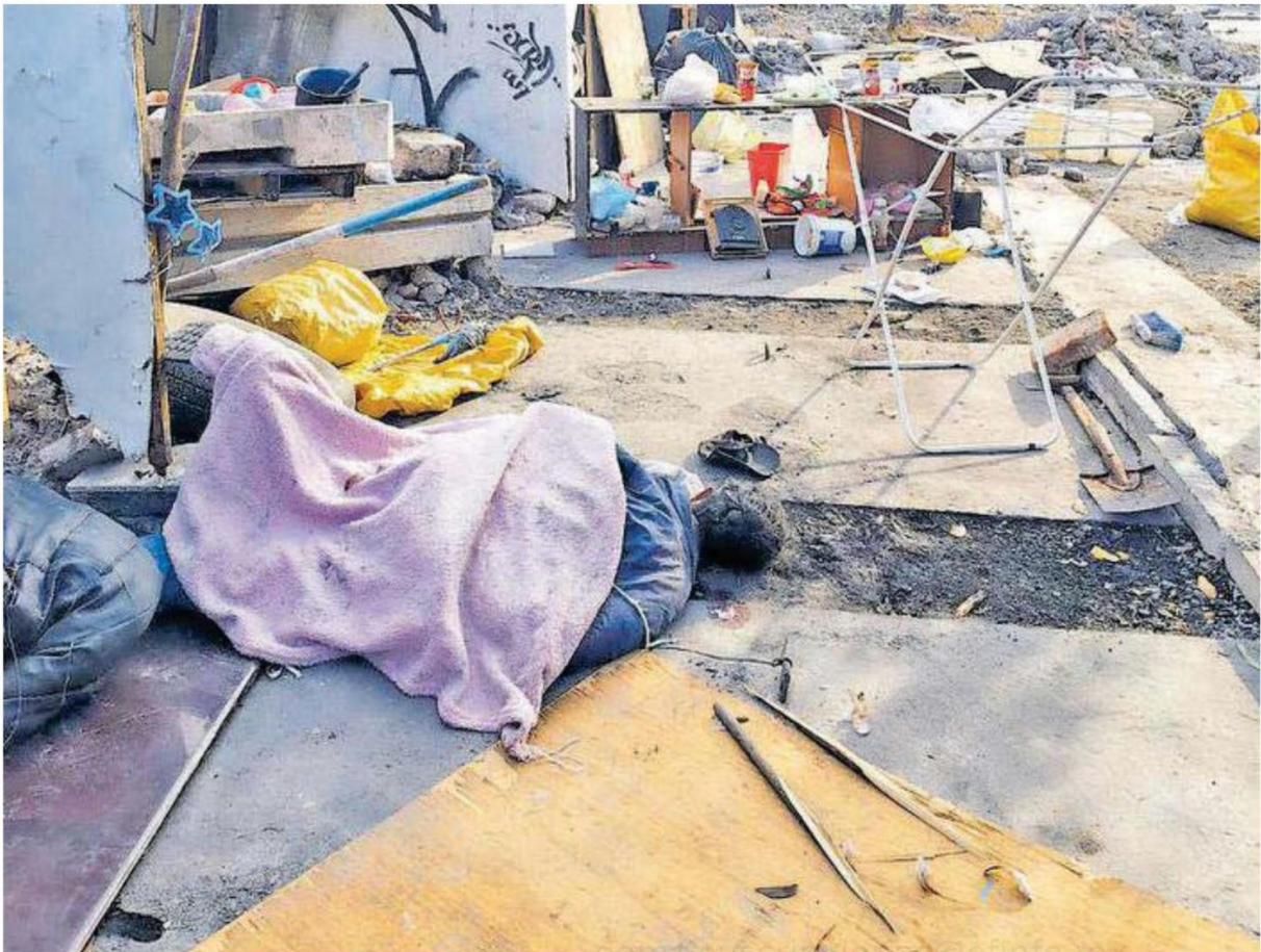
El hombre quedó inconsciente y tirado en la tierra boca abajo en un charco de sangre y tapado con una cobija color rosa hasta la espalda