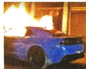
Un vehículo se incendió, al parecer, por un corto circuito.