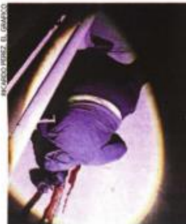
RICARDO HERRERA / EL GRÁFICO