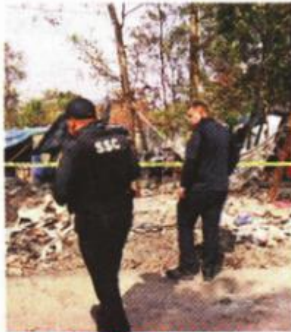
FRANCISCO RODRIGUEZ. EL GRÁFICO