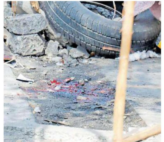
Paramédicos llegaron hasta el lugar donde se encontraba el fallecido y al intentar reanimarlo detectaron que ya no había nada que hacer, pues ya no contaba con signos vitales