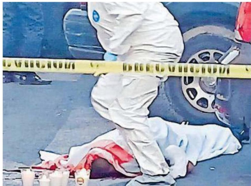
El hombre , de acuerdo a las autoridades, quedó sobre el asfalto junto a un automóvil café boca abajo

Además de que iban a analizar las cámaras del C5 que se encontraban en Norte 64A para conocer cómo sucedió el incidente.