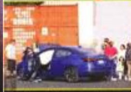
Familiares de la mujer y del automovilista discutieron en el sitio.

Al lugar llegaron familiares, tanto de la fallecida, como del automovilista herido. Ambos grupos iniciaron una discusión sobre quién tuvo la culpa.