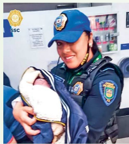
EMERGENCIAS. La Secretaría de Seguridad Ciudadana informó que la mayoría de labores de auxilio de parto se realizan en vehículos.

La SSC especificó que una de las obligaciones que tienen los policías anualmente, es recibir los cursos de primeros auxilios para actuar en casos como es atención de parto.