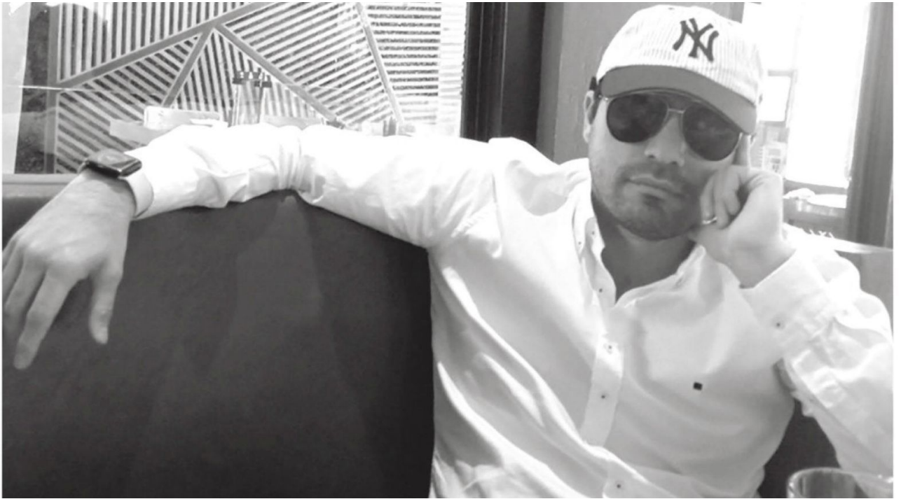
A pesar de sus capturas, el tráfico de estupefacientes no disminuye