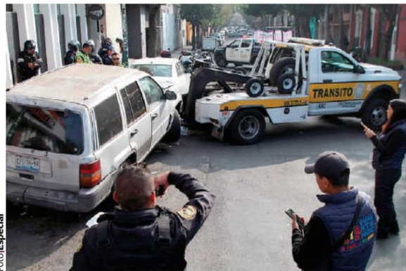
PERSONAL de la alcaldía Cuauhtémoc y de la SSC, durante el retiro de un vehículo abandonado.

Autos trasladó la alcaldía Cuauhtémoc en grúa a depósitos vehiculares