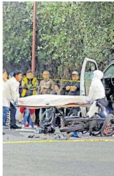
La mujer quedó a un metro de la motocicleta boca abajo y cerca de ella estaba un refresco que habían comprado minutos antes