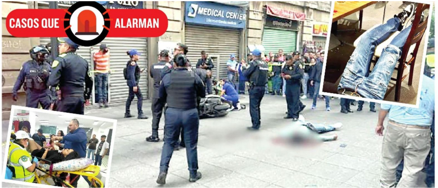
El caso de la lideresa de comerciantes y el de Plaza Miyana, de los más relevantes