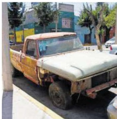
Están abandonados en la vía pública.