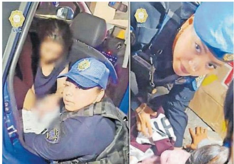
La policía apoyó a 23 mujeres en labores de parto.

Detalló que efectivos sectoriales participaron en los casos, mientras que la Policía Bancaria e Industrial (PBI) asistió a cinco mujeres y la Policía Auxiliar (PA) intervino en siete situaciones. En cinco de estos eventos, se contó con la presencia de paramédicos del Escuadrón de Rescate y Urgencias Médicas (ERUM), mientras que elementos de la Subsecretaría de Control de Tránsito apoyaron en tres nacimientos que se registraron en la vía pública; oficiales de la Policía Turística intervinieron en un caso.