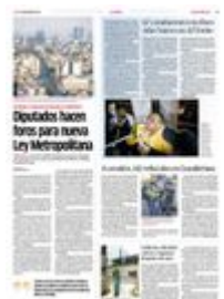
OPERATIVO. La SSC desplegó 110 elementos en distintos puntos del Centro Histórico.