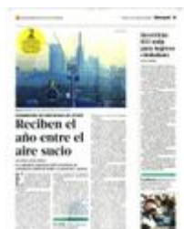
Desde el Cablebús fue muy notoria la nube de contaminación