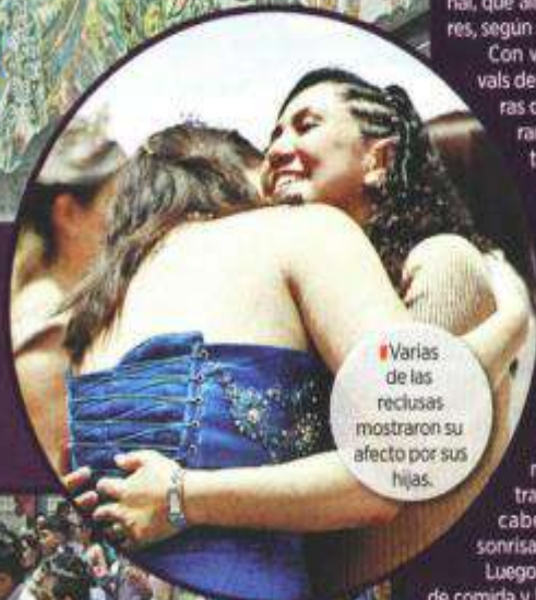
Varias de las reclusas mostraron su afecto por sus hijas.