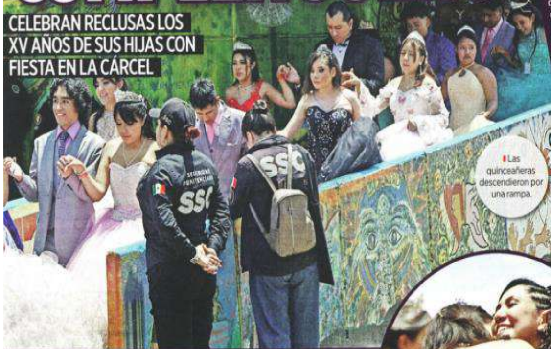
Las quinceañeras descendieron por una rampa.

CELEBRAN RECLUSAS LOS XV AÑOS DE SUS HIJAS CON FIESTA EN LA CÁRCEL