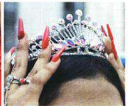
■ Las festejadas lucían sus tiaras, uñas postizas y peinados especiales. Algunas madres arreglaron a sus hijas.