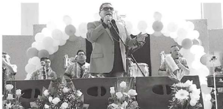
Los Ángeles de Charly pusieron la música y el ambiente

De igual forma se realiza un evento llamado "Rounds por la libertad" para impulsar el boxeo dentro de las cárceles y que los privados de la libertad encuentren una nueva motivación en la vida