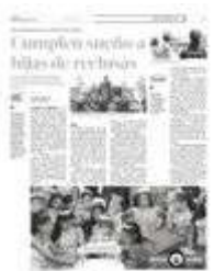
Las festejadas partieron el pastel