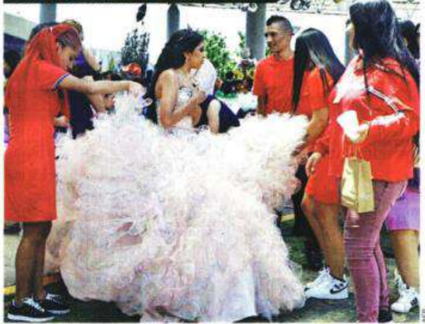
■ El festejo se realizó con apoyo de la fundación Alas de Amor y autoridades penitenciarias.

que comparte videos de su trabajo en las plataformas TikTok y YouTube.