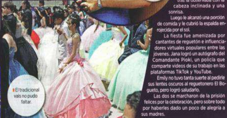
El tradicional vals no pudo faltar.