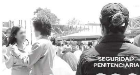
Se balló el tradicional vals

Se espera que este evento se convierta en una tradición al interior del penal femenil