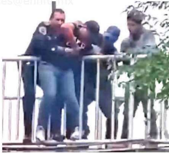
Elementos de seguridad evitaron que una persona atentara contra su vida en lo alto de un puente