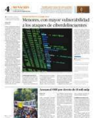
Menores, con mayor vulnerabilidad a los ataques de ciberdelincuentes