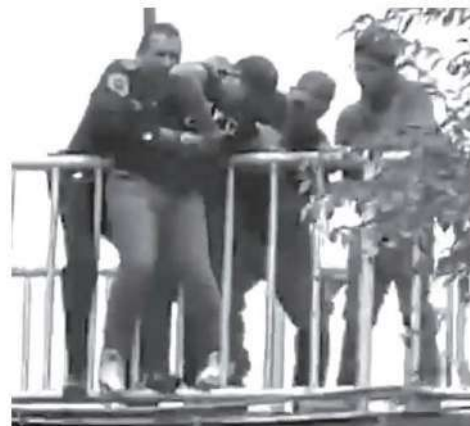
Por poco y escapa por la puerta falsa

El hombre señaló que los problemas familiares lo orillaron a tomar dicha decisión