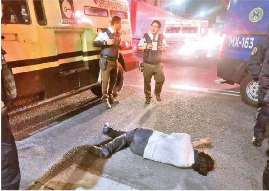
Un hombre fue arrollado por una camioneta de valores y resultó sólo con algoas lesiones