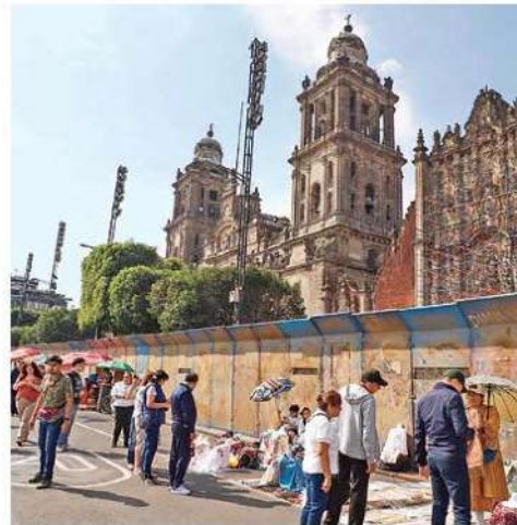
BLINDAJE. Desde la protesta por Ayotzinapa, el martes pasado, el Centro cuenta con edificios protegidos por vallas metálicas.