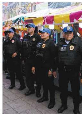
➕ Fue en la colonia Granjas Coapa donde se dio el suceso.

Los hechos ocurrieron en calles de la colonia Granjas Coapa, cuando operadores del C2 Sur informaron a los uniformados de un intento de robo en un inmueble ubicado en la avenida Cafetales, en su esquina con la calle Cañaverales y Calzada del Hueso.