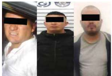
LOS ASALTANTES, en imágenes difundidas en los canales de la la SSC, ayer.

En esos momentos, uno de los sujetos sacó un arma de fuego y realizó disparos en contra de los oficiales, quienes repelieron la agresión, lo que provocó lesiones a uno de los agresores, por lo que fue canalizado a un hospital bajo custodia, pues quedó en calidad de detenido,