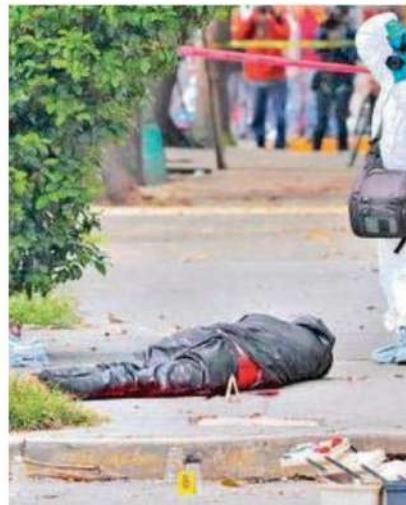
El hombre quedó sobre la acera bocabajo afuera de una refaccionaria, la cual se encontraba cerrada