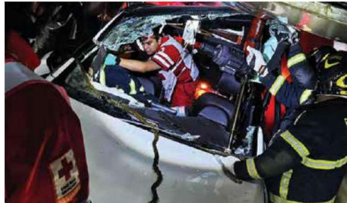
INCIDENTE. El desplome fue en un edificio en la alcaldía MH.

Las autoridades deberán indagar si hubo omisiones o negligencia. #