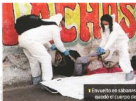
■ Envuelto en sábanas y cobijas quedó el cuerpo de El Güero.