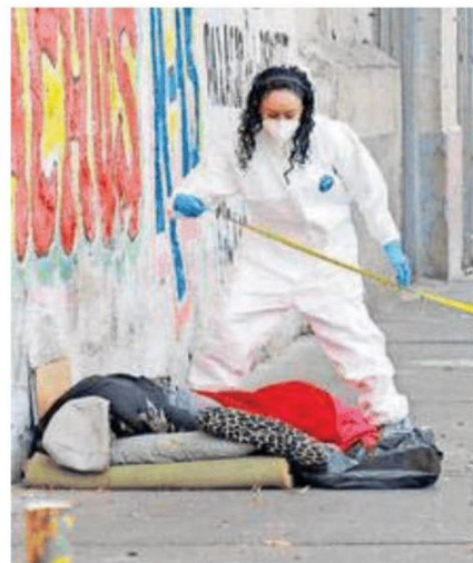
El hombre quedó recostado sobre la banqueta en Avenida Circunvalación