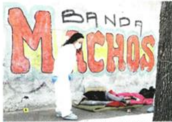
Envuelto en sábanas y cobijas quedó el cuerpo del hombre conocido como "El Güero", en la Calle Vidal Alcocer.