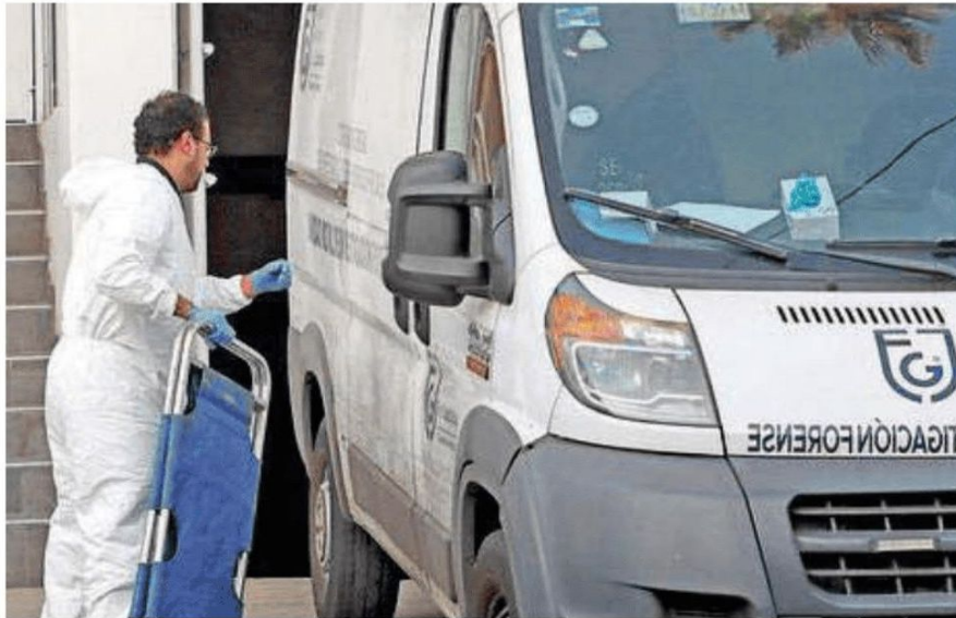
Los hechos se registraron en la calle de Corea, esquina con Cantón, Autoridades investigan cómo sucedieron los hechos