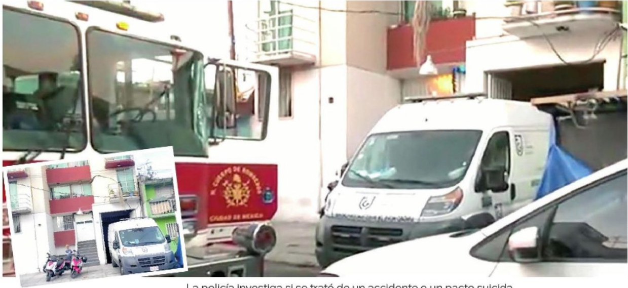
La policía investiga si se trató de un accidente o un pacto suicida