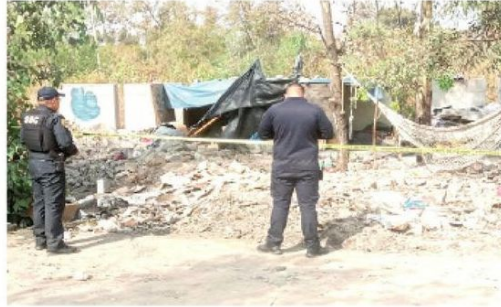
Nadie sabe lo que pasó

La zona fue asegurada por los uniformados, mientras personal de la Fiscalía General de Justicia (FGJCDMX) inició una carpeta de investigación por el delito de homicidio.