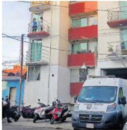
Las autoridades ya investigan.