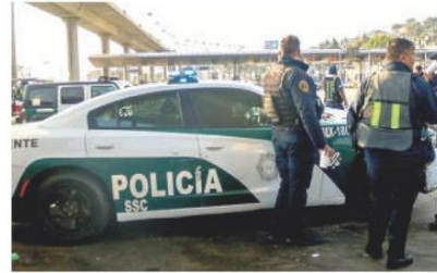
La SSC brindó atención a la víctima.

La SSC confirmó que los detenidos confesaron haber participado en la agresión. ●