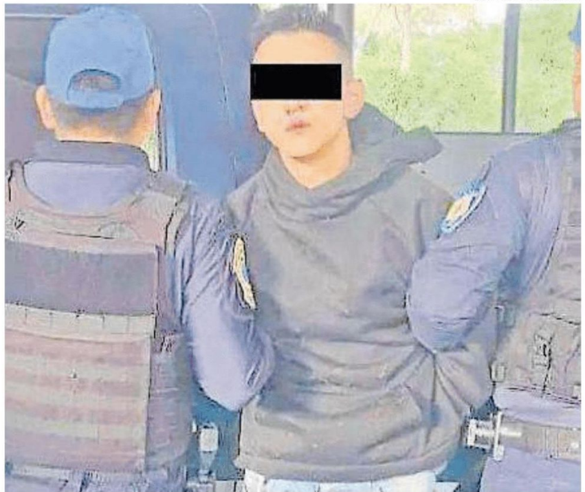
Samuel "N" fue detenido, esposado y llevado al MP más cercano luego de que la parte afectada decidiera proceder en su contra