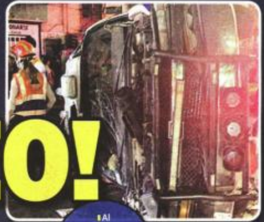
Al momento del impacto, la ambulancia llevaba encendidos los códigos luminosos y la sirena.