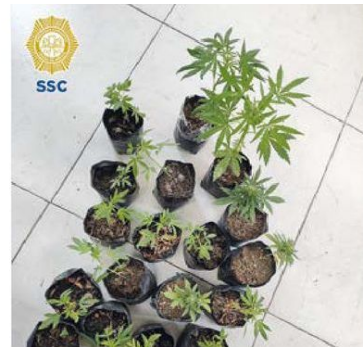
OPERATIVO. El hallazgo tuvo lugar en dos locales de la Central de Abasto, ubicada en Iztapalapa.

años de prisión y doscientos a cuatrocientos días multa, es la pena por narcomenudeo en el país