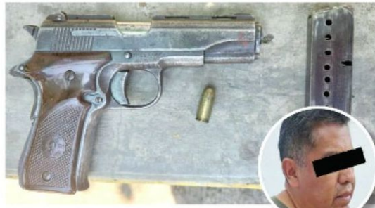
A balazos saldó la deuda

Cabe mencionar que, el responsable presentaba una lesión de bala en la mano derecha, con amputación parcial del dedo anular y solicitó su traslado a un hospital, bajo custodia policial, para su atención médica.