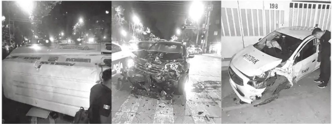
La ambulancia sacó la peor parte