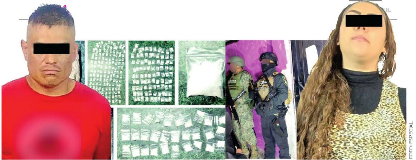
Tenían en su poder drogas de todos colores y sabores