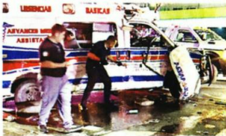
El accidente ocurrió en Eje 1 Poniente y Eje 2 Sur, en la Roma.

El taxista, de 63 años, y el conductor de la camioneta, de 36, resultaron con crisis nerviosa y golpes menores