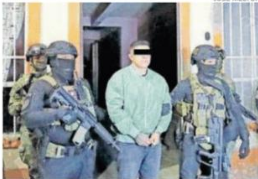
Los imputados quedaron a disposición del MP

Una mujer que estaba realizando una video llamada dijo "ay mano yo vi las luces, estas de colores y luego luego que salgo de la casa para tomar video y fotos, ya hasta salí en la tele", mientras una mujer del otro lado de la pantalla del celular se acomodaba los lentes para ver todo.