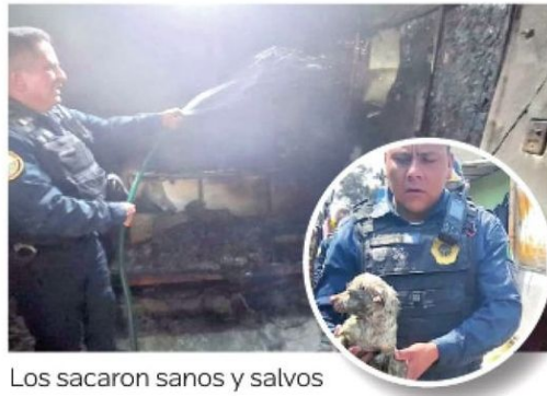
Los sacaron sanos y salvos

Los animalitos de compañía fueron entregados a sus dueños una vez conjurado el peligro.