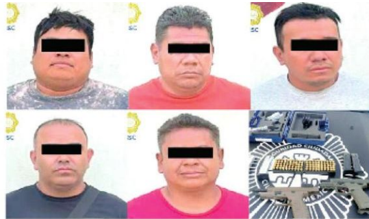
Ya son Investigados

Los detenidos se identificaron como trabajadores de la alcaldía, sin embargo no acreditaron la autorización para portar armas de fuego como parte de sus funciones.