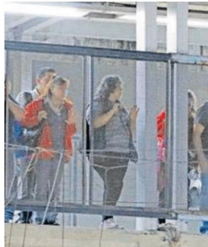
Testigos indicaron a las autoridades que al menos una hora estuvo consciente, agonizando hasta que dejó de moverse