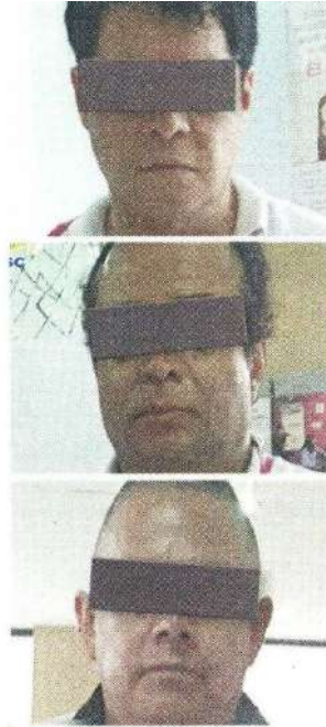
Rostro cubierto por la autoridad

En tanto, los dos empleados del INE, de 50 y 37 años, además del miembro de una institución de seguridad estatal, de 52 años, fueron detenidos.