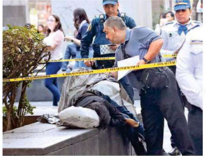
De acuerdo con las autoridades, el hombre quedó recostado sobre una bolsa blanca de lado derecho y con los pies colgados e indicaron que el motivo de la muerte podría haber sido por una congestión alcohólica