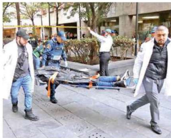
Periciales tuvieron que ocupar la bolsa negra con la que fue cubierto

Aunque el hombre quedó recostado sobre las bancas y el lugar fue acordonado, los comensales y locatarios continuaron con sus actividades como si nada hubiera pasado