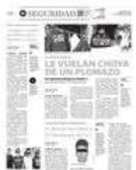
Llegaron y lo atacaron en forma directa