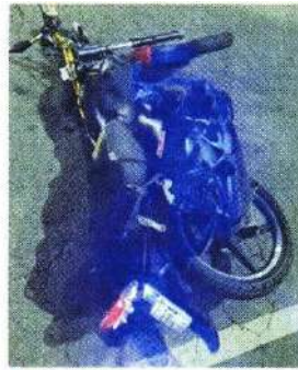
Canal de Chalco fue cerrado mientras retiraban el cuerpo y la moto.

El accidente ocurrió mientras circulaba por los carriles laterales en dirección hacia la Ciudad de México, a la altura de Calle de las Huertas, en la Colonia San Martín Tepetlixpan. La circulación se vio afectada en la zona.