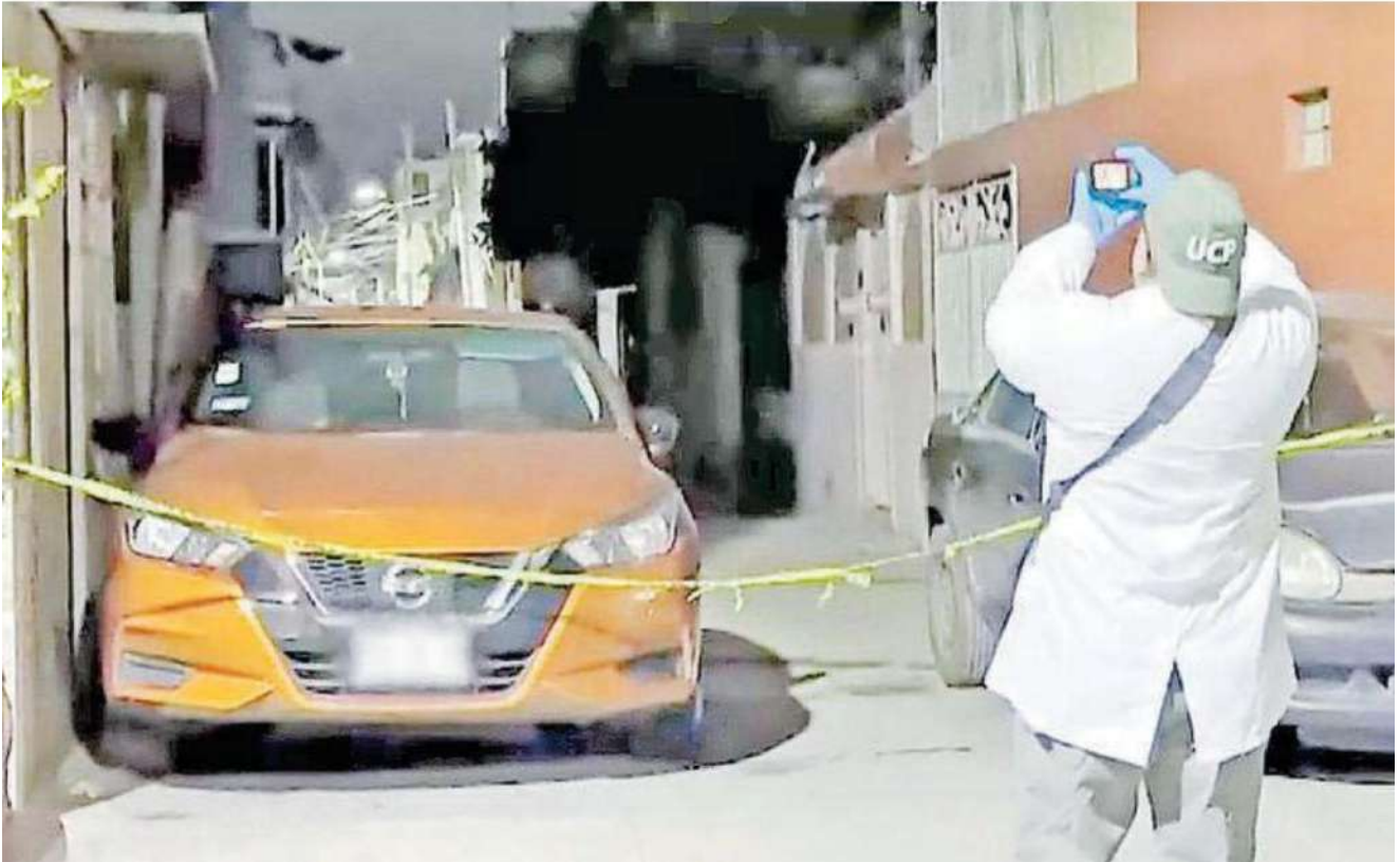
Servicios periciales de la Fiscalía General de Justicia de la Cdmx arribaron al lugar, realizaron las diligencias necesarias y el levantamiento del cuerpo