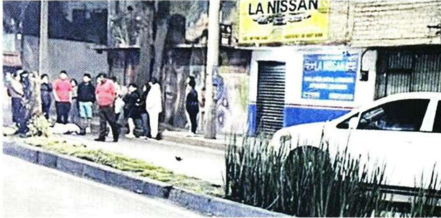
Vecinos de la Colonia José López Portillo, en Iztapalapa, salieron para auxiliar al motociclista.