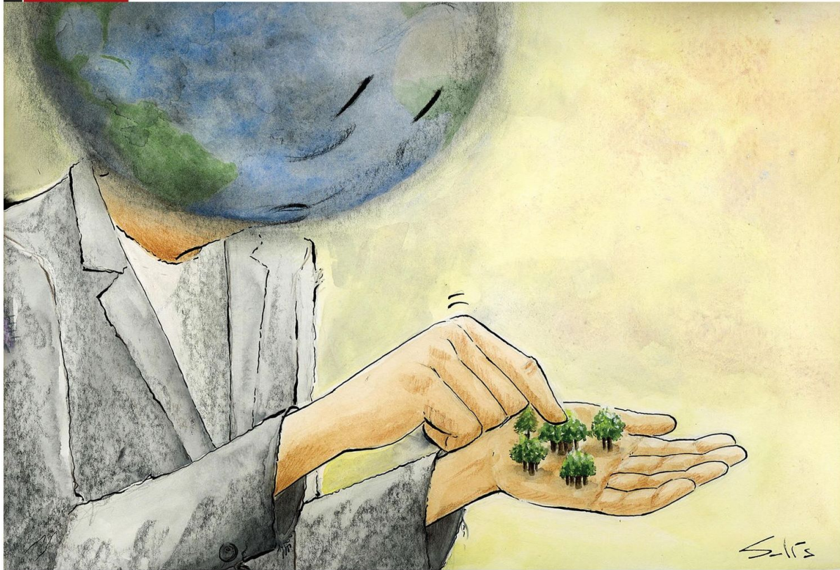
Día Internacional de las contadas Reservas de la Biósfera