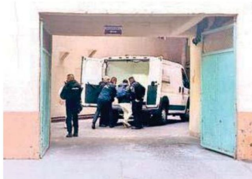
El hombre permanece en calidad de desconocido; fue trasladado al servicio forense