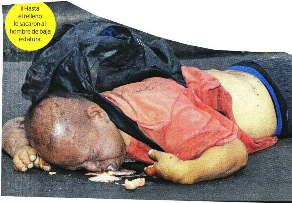
■ Hasta el relleno le sacaron al hombre de baja estatura.