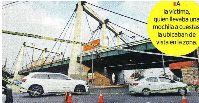
■ A la víctima, quien llevaba una mochila a cuestas, la ubicaban de vista en la zona.