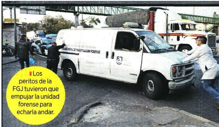
■ Los peritos de la FGJ tuvieron que empujar la unidad forense para echarla andar.