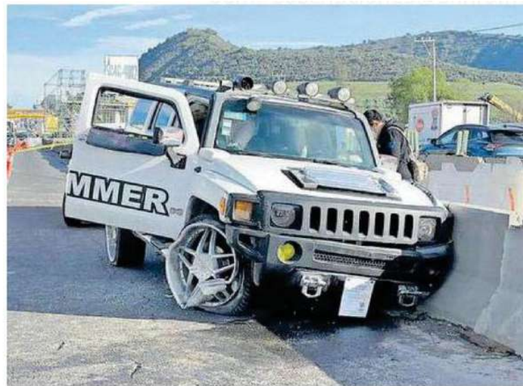
Cuando la camioneta chocó, los criminales aprovecharon para realizar dos disparos más justo de frente a la unidad

El sitio permaneció a resguardo de los uniformados por más de tres horas hasta el arribo de personal de Investigación Forense y Servicios Periciales quienes tras concluir las diligencias trasladaron el cadáver al anfiteatro correspondiente donde continuarán las investigaciones para localizar a sus familiares y a los homicidas.