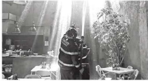
Los vulcanos controlaron la situación