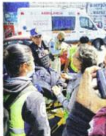
Una policía auxiliar sufrió una crisis nerviosa y un bombero resultó intoxicado por inhalación de humo.

y luego se sumaron bomberos, quienes no batallaron para extinguirlo.