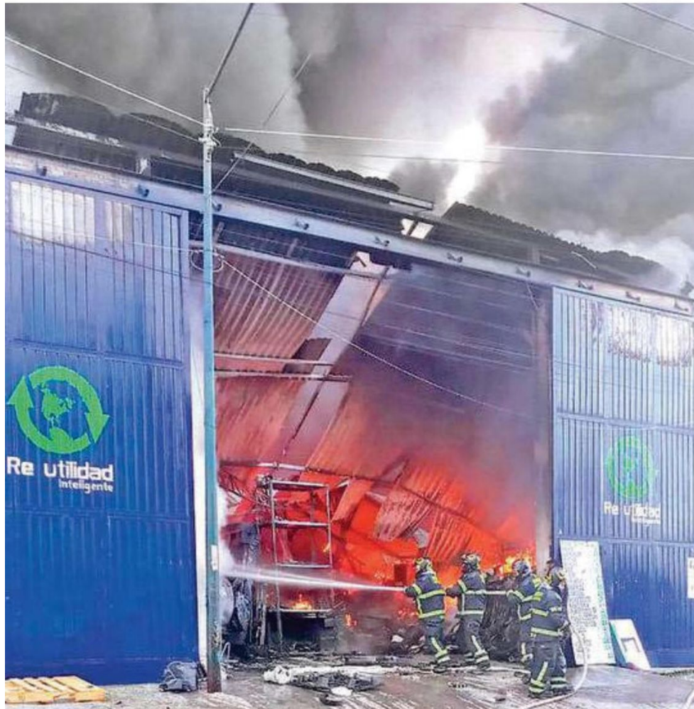
Los trabajadores intentaron apagar el fuego, cosa que no fue efectiva, pues la mayoría del material que trabajan ahí era plástico y cartón, lo que aceleró el incendio