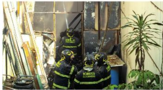
Se reportó saldo blanco

Las llamas alcanzaron el área de indicios de la dependencia de justicia capitalina