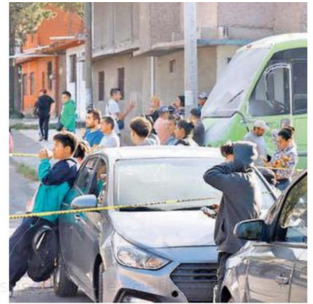
Los habitantes de la vecindad salieron preocupados porque se les quemara su casa y con el rostro tapado para no inhalar el humo que salía de la fábrica de reciclaje