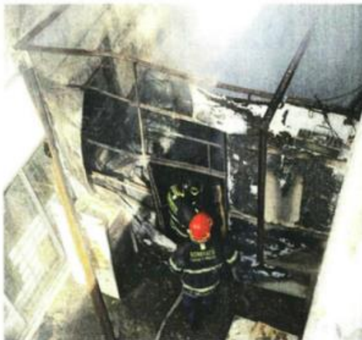
El sitio tenía una superficie de alrededor de 12 metros cuadrados y se almacenaba archivo muerto.

Personal de Protección Civil comenzó a combatir el incendio con cubetas de agua