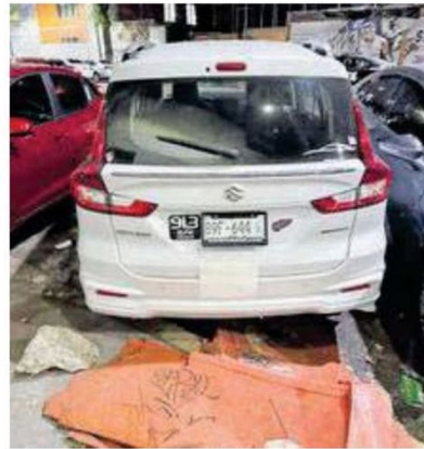
Karla fue agredida en su vehículo

El lunes se prevé una protesta pacífica afuera de la Fiscalía local para exigir justicia para la conductora de Uber