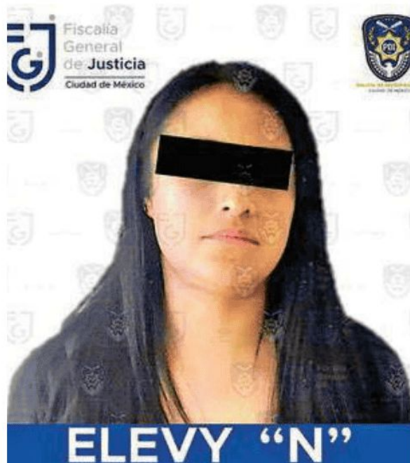
La detenida se dedicaba a extorsionar a comerciantes ambulantes en la alcaldía Cuauhtémoc