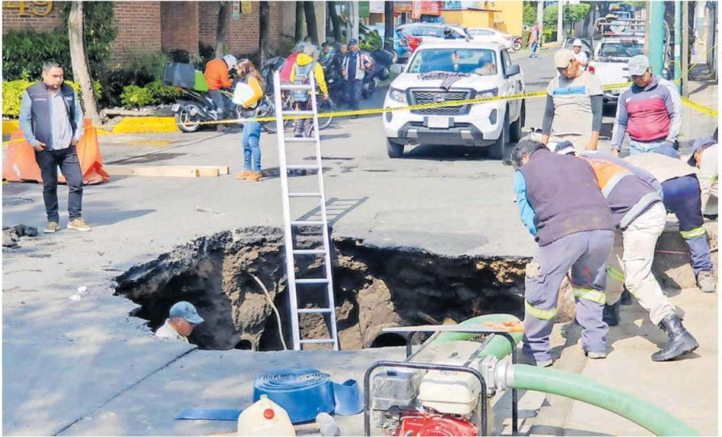
La intensa lluvia, al parecer, causó que el pavimento se reblandeciera y se abriera un socavón, de aproximadamente 5 metros de diámetro, en Cerrada del Arenal 449, en la Colonia Colinas del Bosque