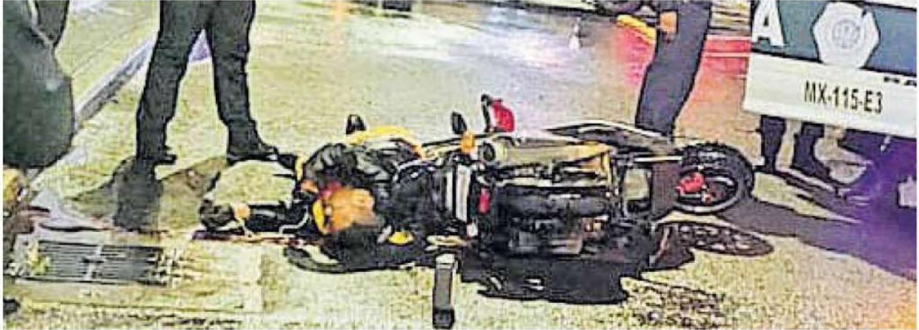
Automovilistas que cruzaban por la zona dieron aviso a las autoridades a través del 911