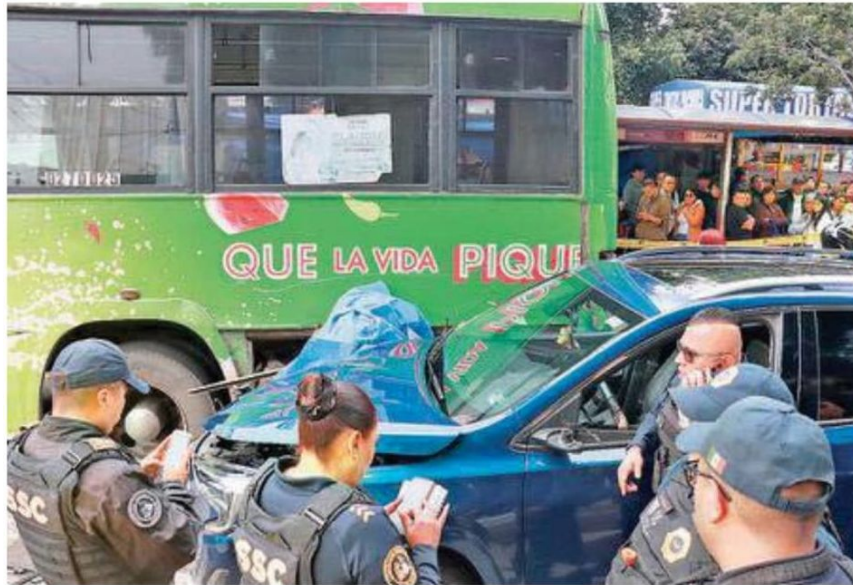
Luego de dos días el conductor que atropelló a un presunto delincuente fue puesto en libertad, también el operador del camión