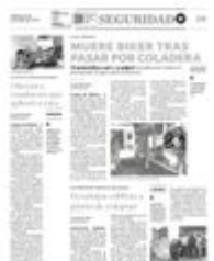
Las lluvias ocasionan este tipo de accidentes