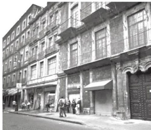
90% de estos delitos quedan impunes

· Al menos ocho casos de robo con violencia se reportan en 12 meses