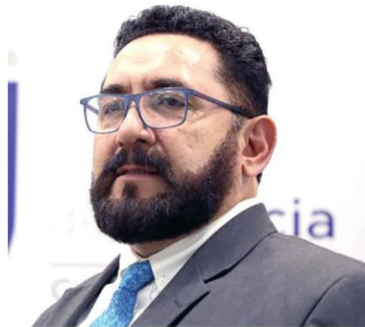
· El funcionario reemplazó a Ernestina Godoy

· La publicación de la terna será el 2 de diciembre