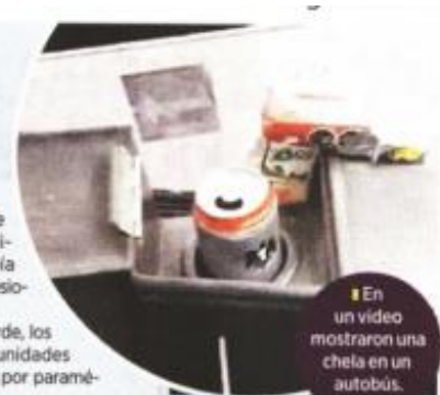
En un video mostraron una chela en un autobús.

Para agilizar el paso de los automovilistas, policías de Tránsito iniciaron un protocolo de seguridad.