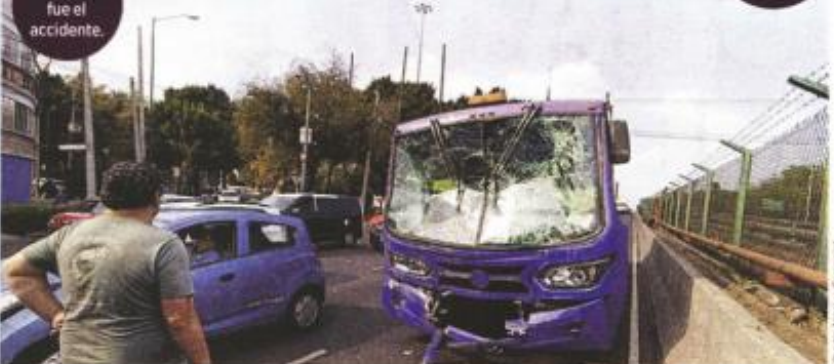
Por alcance fue el accidente.