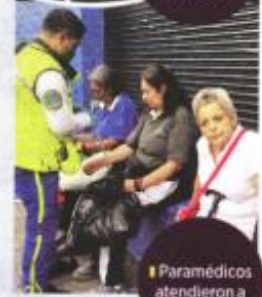
Paramédicos atendieron a los usuarios.