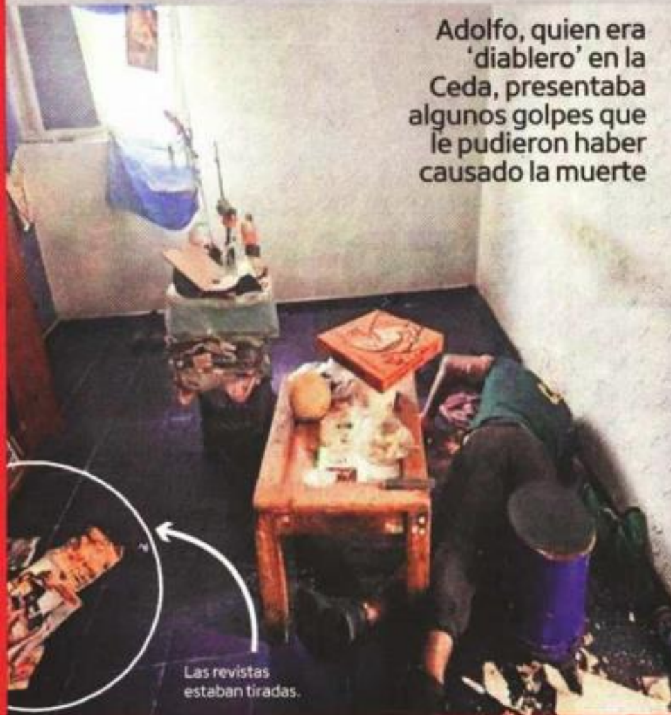
Las revistas estaban tiradas.