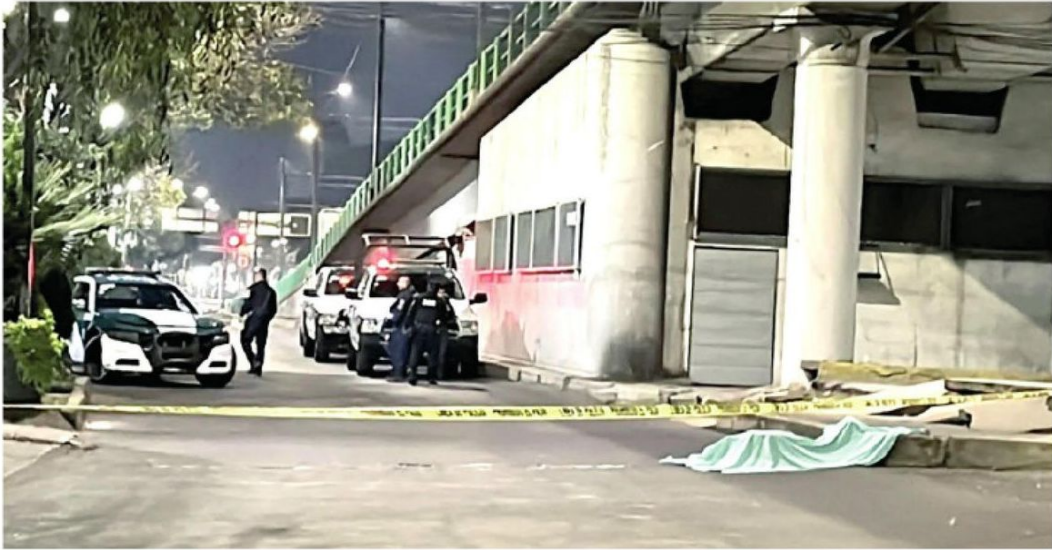
El adulto mayor encontró una muerte instantánea