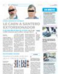
· Se dedicaba hacer "limpias" para eliminar malas vibras