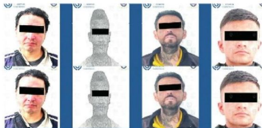
· Erika "N" era la vendedora

Las alcaldías de los hechos fueron Cuajimalpa, GAM, Iztapalapa, Cuauhtémoc, Magdalena Contreras y Venustiano