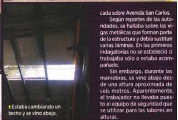
Estaba cambiando un techo y se vino abajo.