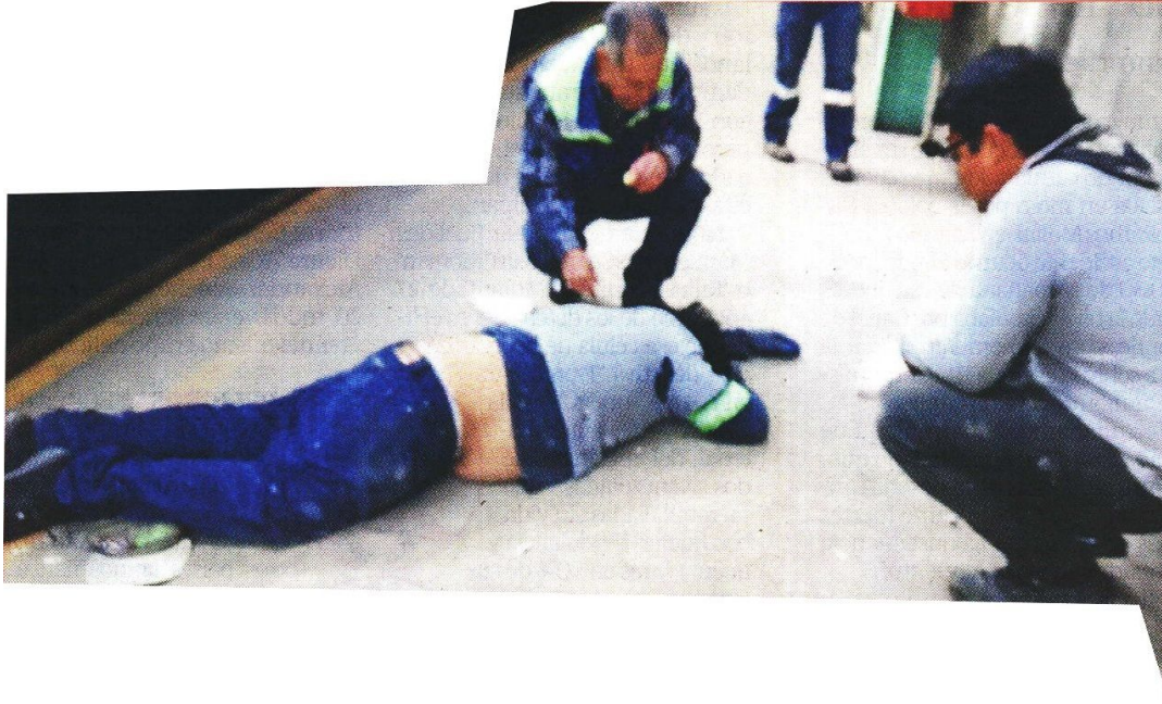
El trabajador externo cambiaba las láminas de la techumbre cuando se precipitó unos 6 metros y falleció