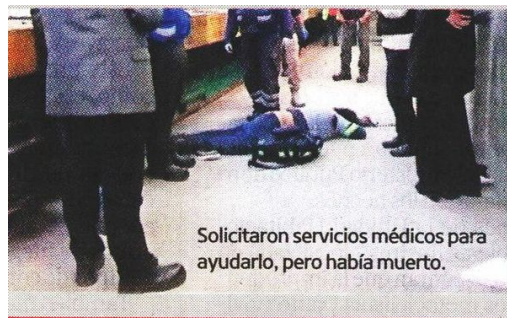
Solicitaron servicios médicos para ayudarlo, pero había muerto.