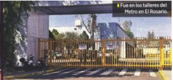
Fue en los talleres del Metro en El Rosario.