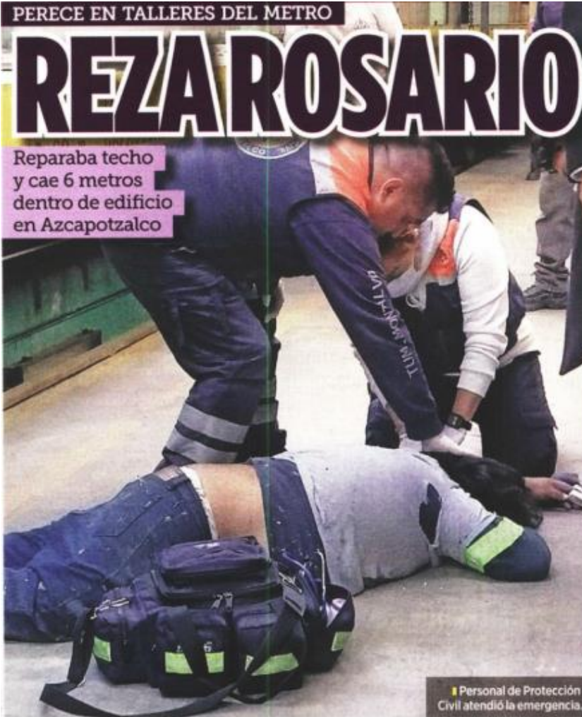
Personal de Protección Civil atendió la emergencia.

Reparaba techo y cae 6 metros dentro de edificio en Azcapotzalco