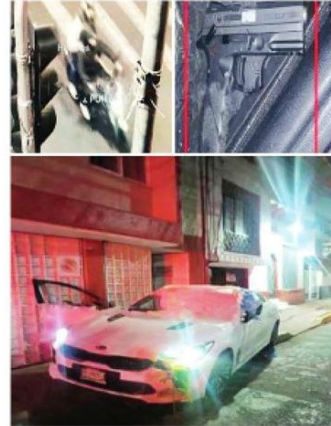
Se indaga el móvil

La Fiscalía capitalina aún no establece el móvil del asesinato, sin embargo, todo apunta a una venganza en contra los hermanos.