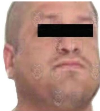
Ya se encuentra tras las rejas

En los sonideros aprovechaban la oportunidad para vender estupefacientes.