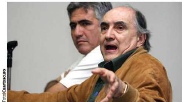
EL ANALISTA político Alfredo Jalife fue aprehendido en la Ciudad de México. Aquí, en imagen de archivo.