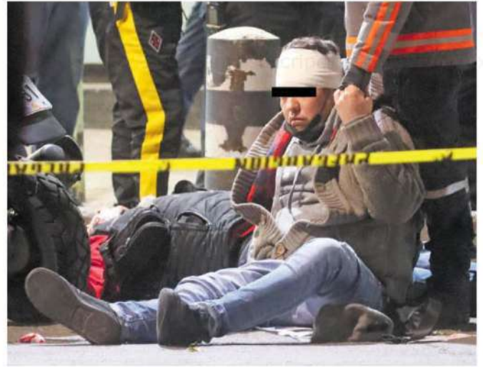
Un par de sujetos armados le dieron alcance a sus víctimas y dispararon contra ellos en varias ocasiones, logrando causarle lesiones mortales a un hombre