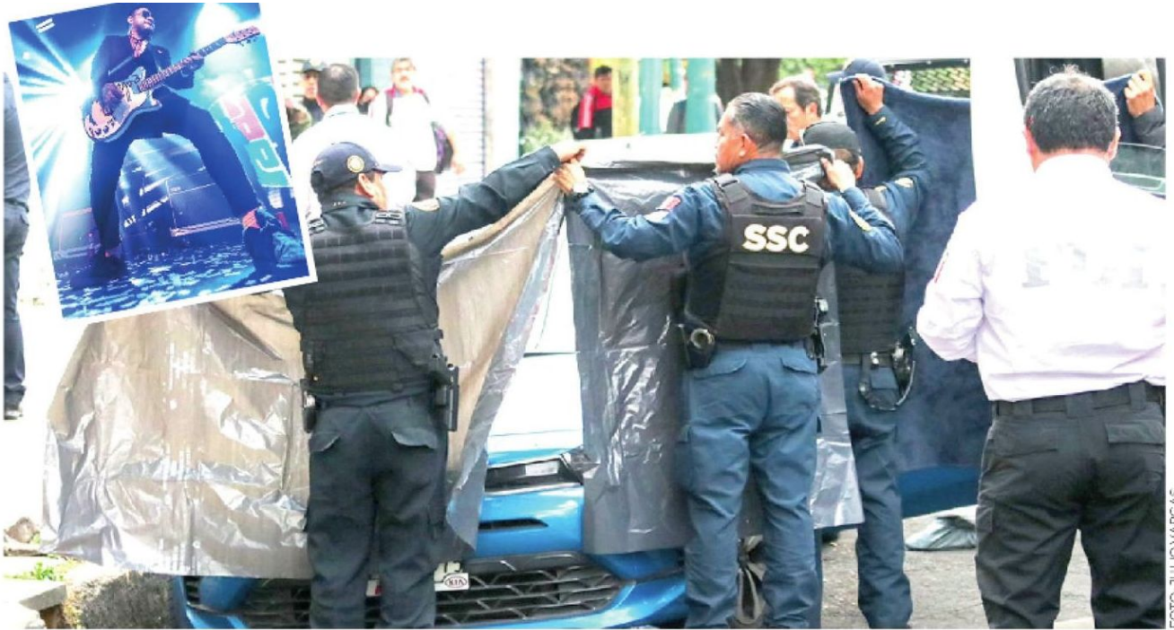
Profunda tristeza causó la muerte de talentoso músico