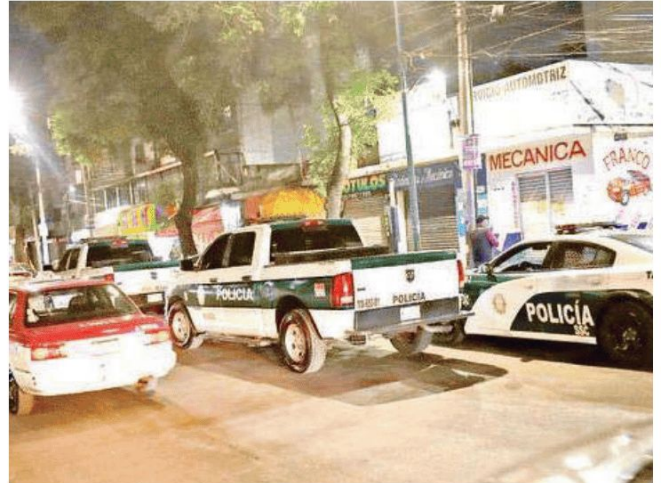
Los elementos policiacos procedieron a acordonar el área para resguardar los indicios balísticos y cualquier otro tipo de prueba