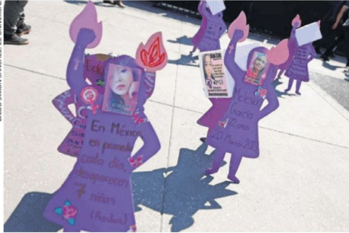
Desde el primer momento de la investigación el personal de la FGJ deberá iniciar las indagatorias por cuestiones de género, destaca el protocolo.