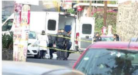
Se presume que se trató de una venganza

La FGJ inició una carpeta de investigación por homicidio doloso por disparos de arma de fuego, mientras personal de Servicios Periciales recabó algunos indicios y realizó el levantamiento del cuerpo de la víctima.