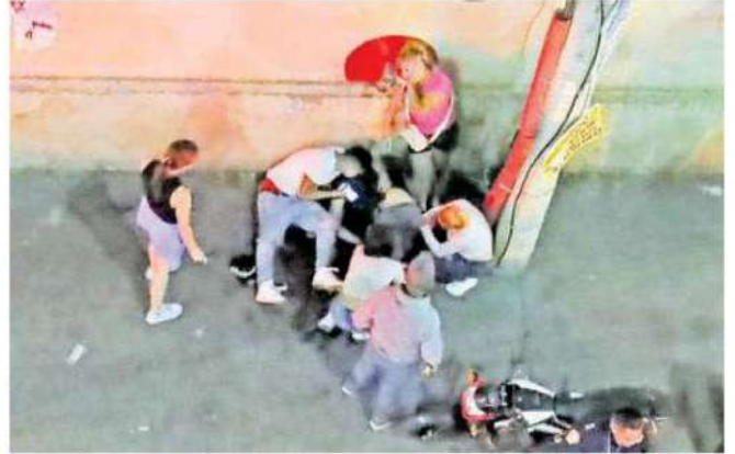
Familiares del occiso llegaron al lugar y lloraron la pérdida, pero también exigían que las autoridades interrogaran a su novia