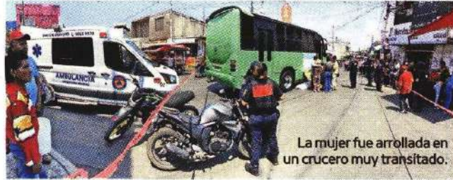
La mujer fue arrollada en un cruceo muy transitado.

"El conductor de 26 años, con quien se entrevistaron, les dijo que no se percató de la persona, por lo que fue detenido, le informaron sus derechos de ley y fue presentado, junto con el vehículo, ante el agente del Ministerio Público correspondiente, quien determinará su situación jurídica", informó la Secretaría de Seguridad Ciudadana capitalina.