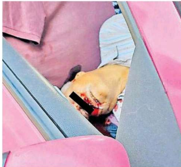
Policías descartaron que alguien pudiera haberle disparado con un arma de fuego, debido a que el auto no contaba con impactos de bala

Cabe destacar que en esta parte de Cuauhtémoc las calles tienen inclinaciones de aproximadamente 45 grados y para vehículos que no son de la zona es más complicado controlar las subidas y bajadas.