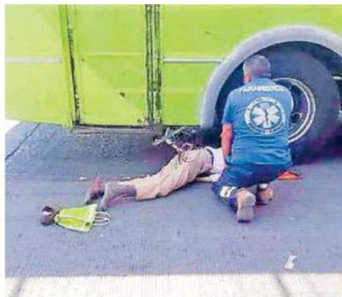
Hasta la zona donde quedó el cadáver de la mujer llegaron los familiares, quienes lloraban desconsolados la muerte de su ser querido

El sitio permaneció acordonado por más de tres horas hasta que Personal de la fiscalía capitalina realizó las diligencias y trasladaron el cuerpo sin vida de la adulta mayor hasta el anfiteatro correspondiente.