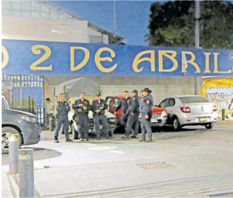
Los hechos se registraron en el inmueble ubicado en calle Pensador Mexicano esquina con 2 de Abril, colonia Guerrero, alcaldía Cuauhtémoc //JOSÉ MELTON