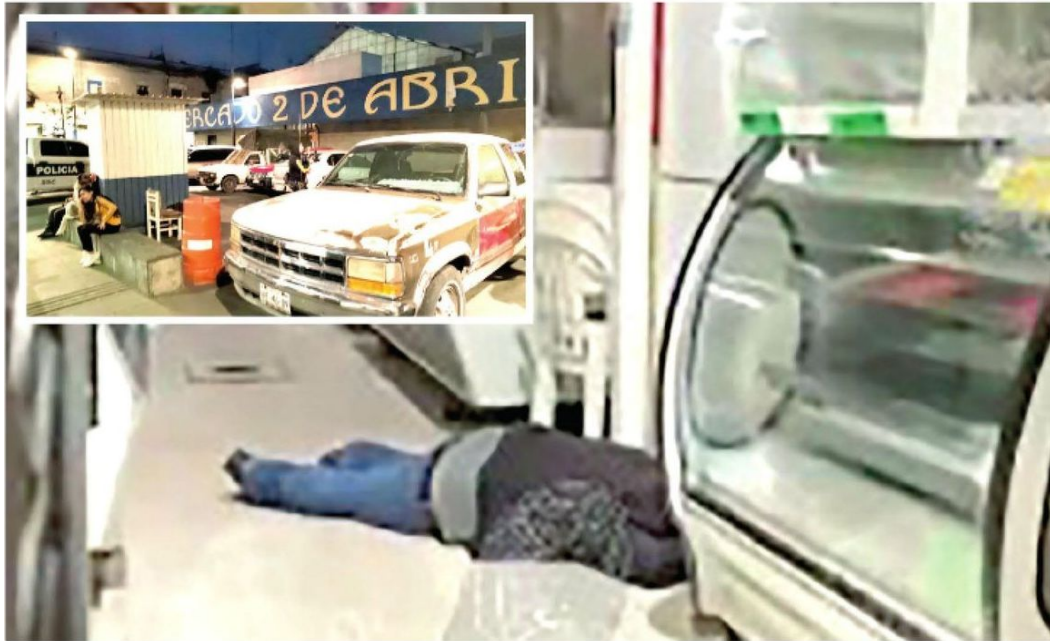
-Lo atacaron directamente a su negocio