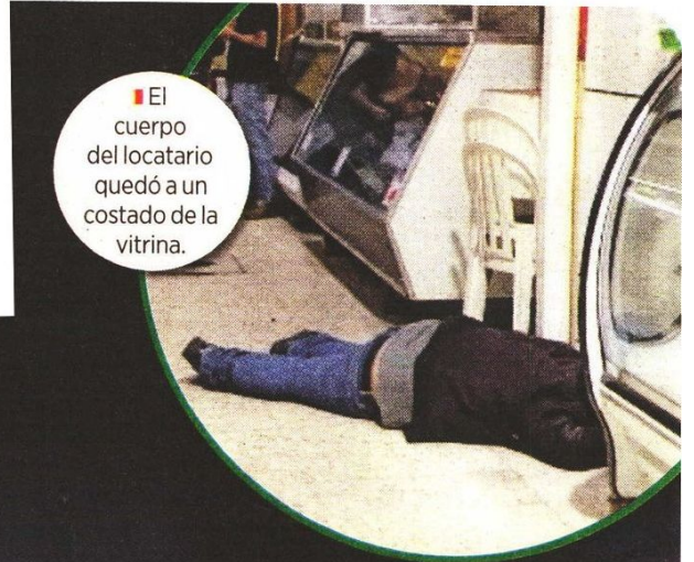
El cuerpo del locatario quedó a un costado de la vitrina.