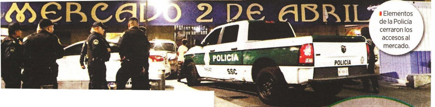
Elementos de la Policía cerraron los accesos al mercado.