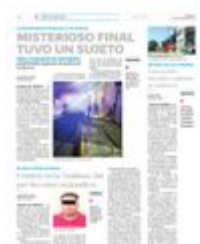
Vecinos descubrieron el cuerpo inerte