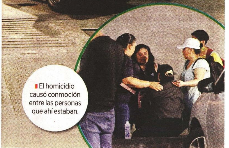
El homicidio causó conmoción entre las personas que ahí estaban.