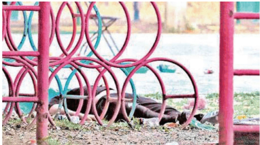
Pánico entre usuarios de la unidad deportiva, donde fue la agresión para silenciar a un individuo

Minutos más tarde personal de Investigación Forense y Servicios Periciales realizaron el levantamiento de por lo menos 10 indicios balísticos y tras concluir las diligencias trasladaron el cadáver al anfiteatro correspondiente donde continuarán las investigaciones para localizar a los homicidas.