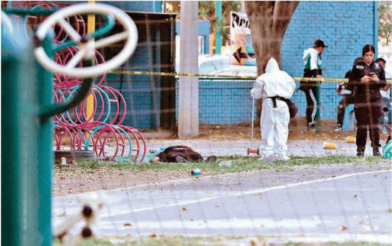
Un hombre recibió al menos 10 balazos en una agresión directa cuando echaba cascarita en Iztapalapa