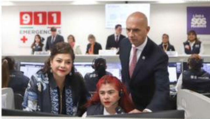
Clara Brugada, jefa de Gobierno de la CDMX, y Salvador Guerrero Chiprés, titular del C5, encabezaron el reconocimiento al equipo de la línea de emergencia 911.

RECONOCIMIENTO AL EQUIPO HUMANO En el evento, se hizo un reconocimiento especial a los operadores y operadoras, cuya plantilla creció de 124 a 209 durante la administración de Claudia Sheinbaum.