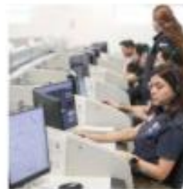
La plantilla de operadores aumentó al pasar de 124 a 209 personas.

La jefa de Gobierno concluyó: "Que viva el 911, una línea que está ahí para ustedes, sin descanso, como aliada en los momentos de mayor necesidad".