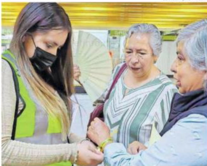
Atención gratuita en el Metro ante crisis emocionales.

Detalló que en diversos casos buscaron a los familiares para que acudieran al lugar para dar la atención requerida y en otras situaciones fueron trasladados a unidades de atención para que recibieran atención especializada.