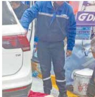
➕ Policías capitalinos detuvieron a un venezolano de 18 años.

Luego la policía capitalina detuvo a un venezolano de 18 años acusado del doble homicidio.