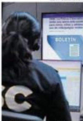
Monitorearán diversas redes.