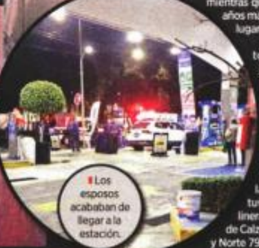
Los esposos acababan de llegar a la estación.