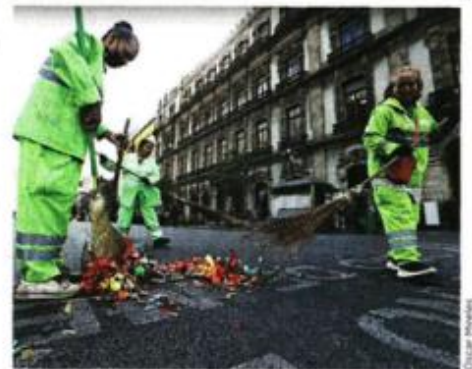
Edgardo Herrera / Contraste