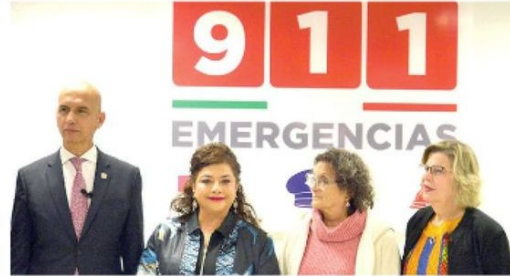
· Más reportes en ztupalapa, GAM y Tlalpan

Desde su inicio, el 911 ha permitido la movilización día con día de cerca de 4 mil unidades de emergencia, incluyendo patrullas, además de ambulancias y bomberos.