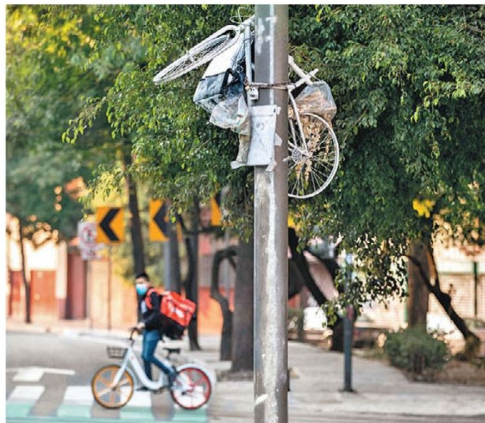
Cada año mueren atropellados 90 repartidores. J. QUINTANAR

• FUENTE: Ni Un Repartidor Menos • INFORMACIÓN: Guillermo Rivera • GRÁFICO: Moisés Butze