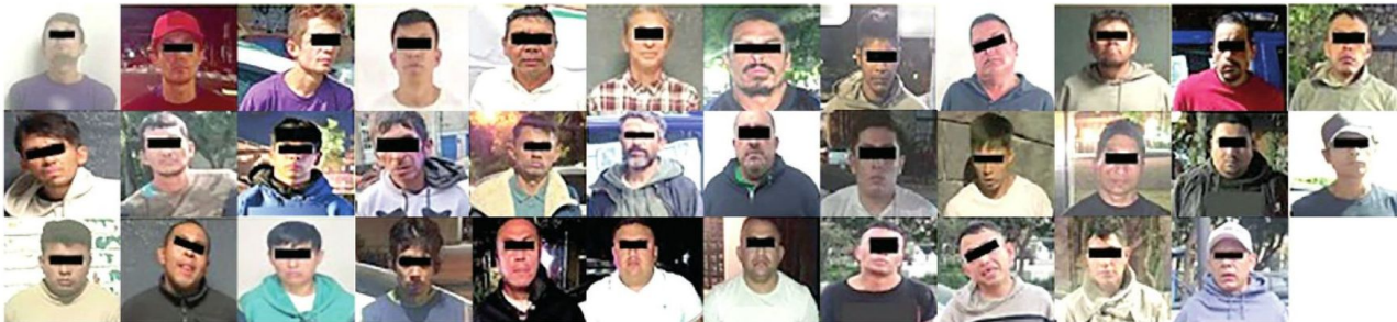
Varias bandas fueron desarticuladas por las SSC