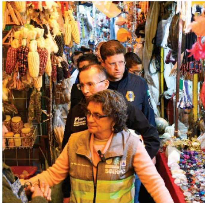
Operativo "Cero Pirotecnia".

El operativo concluyó este martes con la revisión de los mercados Santa Anita, Agrícola Oriental, Leandro Valle y Juventino Rosas en Iztacalco, donde también se emitieron recomendaciones en materia de protección civil para evitar incidentes. ● (Gerardo Mayoral)