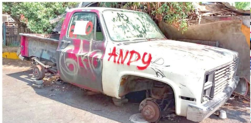
· Se trata de un problema constante en la demarcación

· La colonia Desarrollo Urbano Quetzalcóatl es una de las que presenta más casos de autos abandonados con quejas en 12 calles