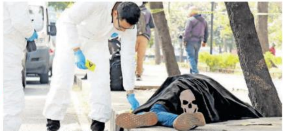
El occiso fue cubierto por los agentes policiales con una sábana negra que tenía una calavera