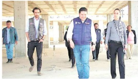
· Destacó los avances y proyectos a atender

· La alcaldía que es la segunda más extensa y menor densidad poblacional apunta a superar varios retos