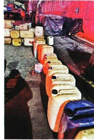
En total, 2 mil litros de hidrocarburo se aseguraron.

A raíz del operativo realizado, la zona fue resguardada por personal de seguridad para la continuidad de las (investigaciones) correspondientes”.