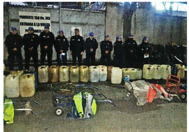
El combustible era almacenado en bidones.