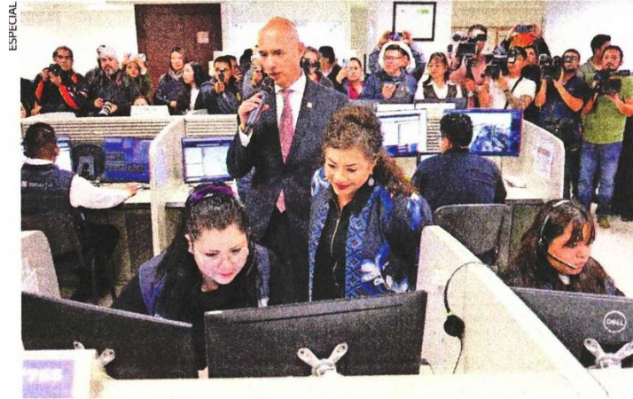
La jefa de Gobierno, Clara Brugada, aseguró que el 911 es el principal instrumento de contacto entre autoridades y ciudadanos.