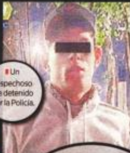
Un sospechoso fue detenido por la Policía.