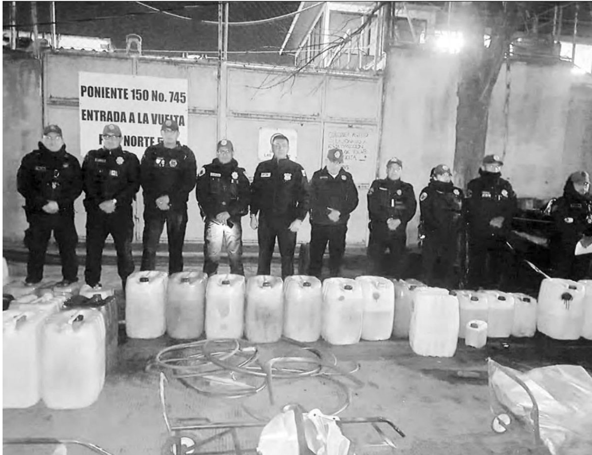
► Los bidones estaban entre otros que contenían agua que era usada en un autolavado callejero.