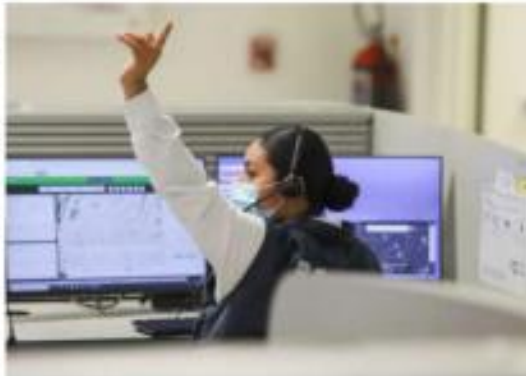
De manera inmediata, se atienden reportes de incendios, robos, accidentes automovilísticos, urgencias médicas, entre otros, las 24 horas, los 365 días del año.