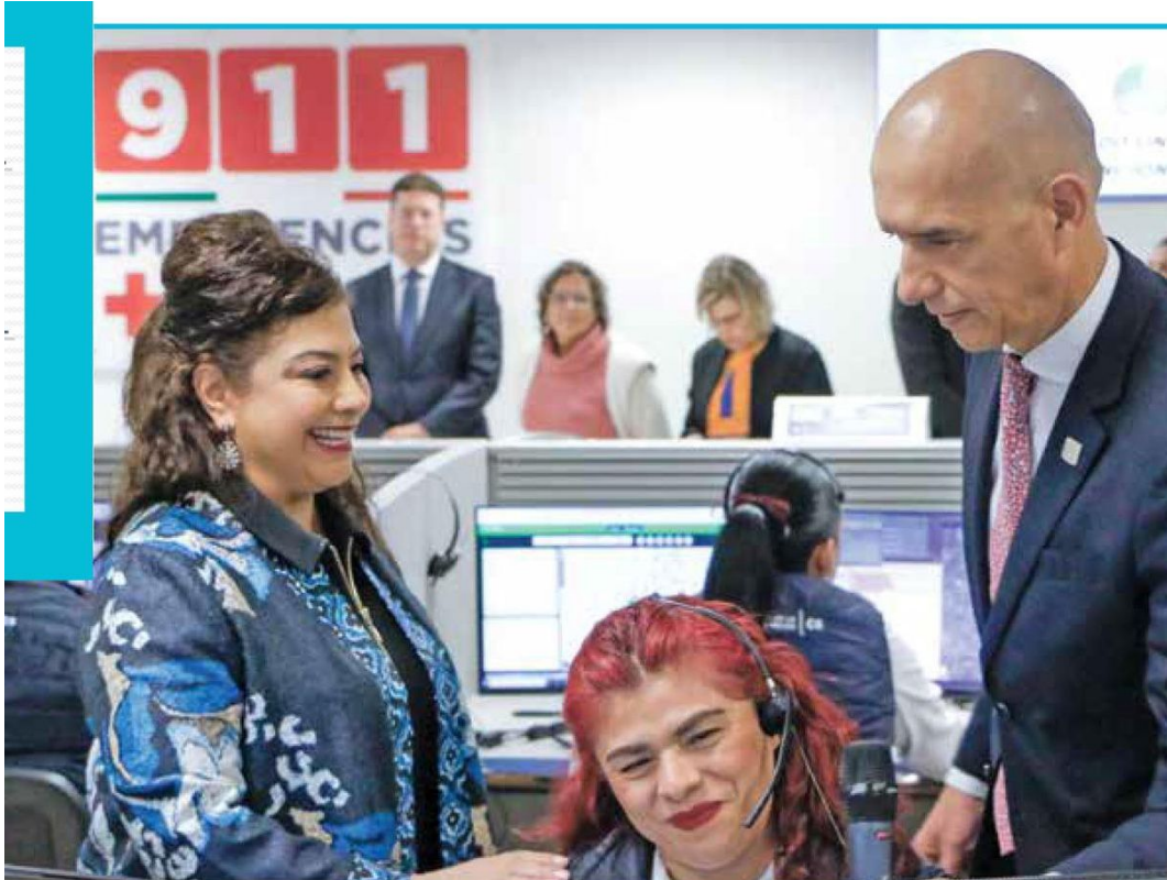
ATENCIÓN. La jefa de Gobierno entregó reconocimientos a los operadores.