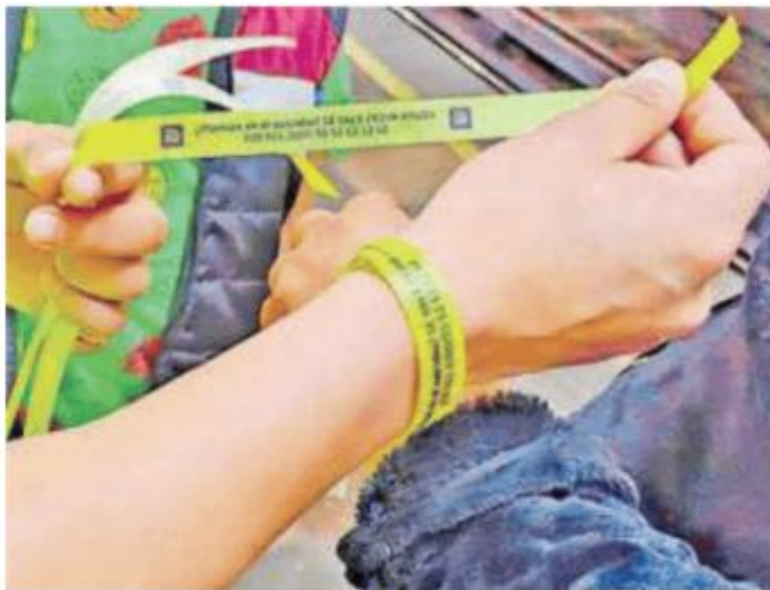
El Metro reconoce la labor de los efectivos policiales

Este programa permite resaltar la labor de los efectivos de la SSC CdMx adscritos al Metro, quienes, a través de la capacitación continua, tienen conocimiento para acercarse a personas con crisis emocionales visibles y poder disuadir o contener.