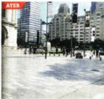
El Andador Ángela Peralta, antes abarrotado por ambulantes, lució ayer despejado.

de cosas y había tantos que puede haber un accidente", apuntó.