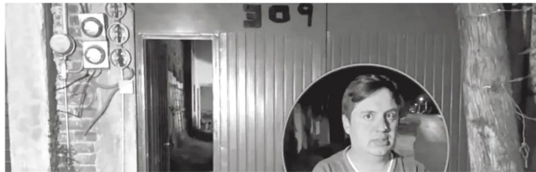
Puso en riesgo su vida, pero la libró

La fiscalía capitalina ya inició la investigación correspondiente para dar con los responsables.