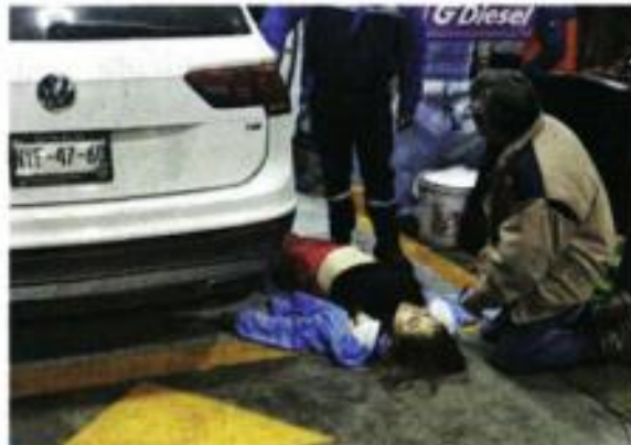
El matrimonio fue baleado en la estación ubicada en la esquina de Calzada Camarones y Norte 79-A, Colonia Clavería.