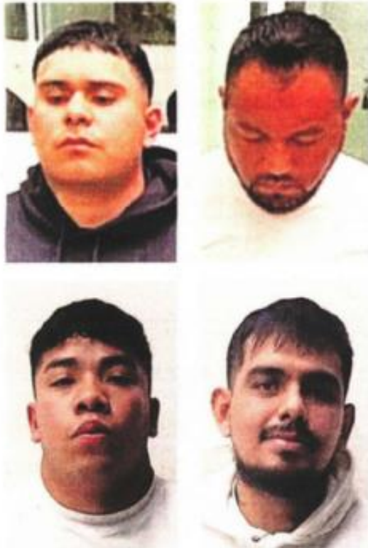
Los sujetos fueron detenidos tras labores de vigilancia de agentes de investigación en el Centro Histórico.

sultados, la detención se logró en la calle de Donceles y República de Chile, en la colonia Centro.