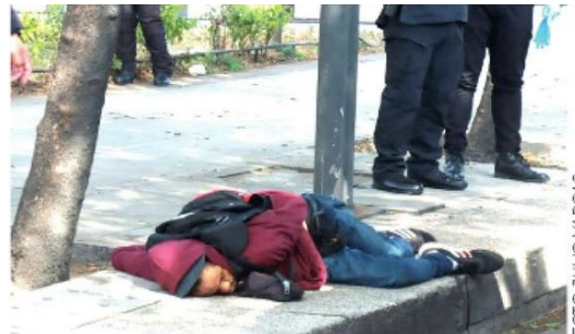
Le dieron de cuchilladas

Se presume que el hombre caminó herido varios metros, ya que fue dejando rastros de sangre, hasta que cayó fulminado junto a un árbol.