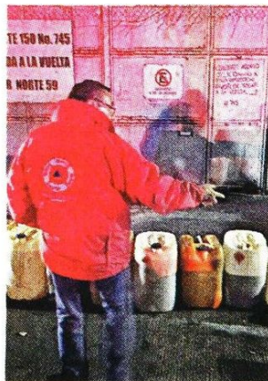
El aseguramiento ocurrió la madrugada de ayer.