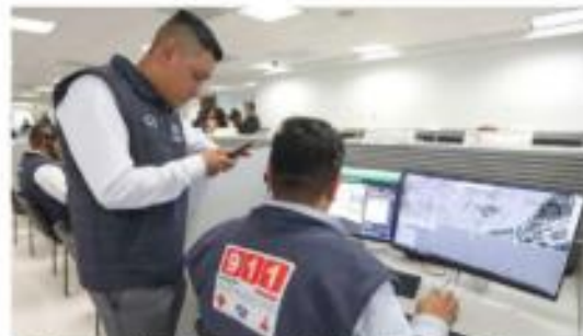
Desde su creación el 9 de enero de 2017, el 911 ha evolucionado para atender un promedio de 5 mil llamadas diarias.