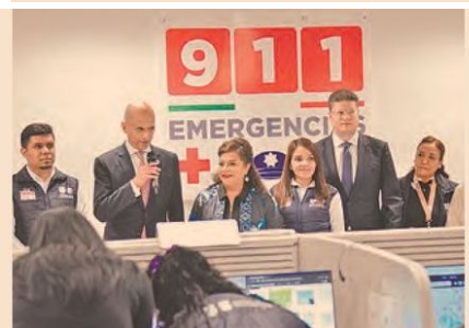
Se hizo un llamado a los habitantes de la gran ciudad, en el sentido de no hacer llamadas de broma a los números de emergencia.

Las llamadas al 911 contemplan a dependencias como la Secretaría de Seguridad Ciudadana, Bomberos, Protección Civil, el ERUM y las denuncias por extorsión, violencia de género, violencia contra animales de compañía.