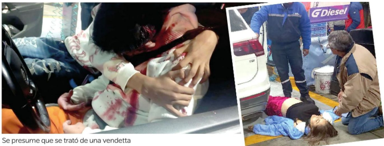
Se presume que se trató de una vendetta

Las víctimas eran comerciantes de tenis, por lo que no se descarta que el móvil haya sido por una extorsión, lo cual ya indaga la Fiscalía capitalina.