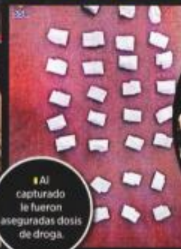
Al capturado le fueron aseguradas dosis de droga.