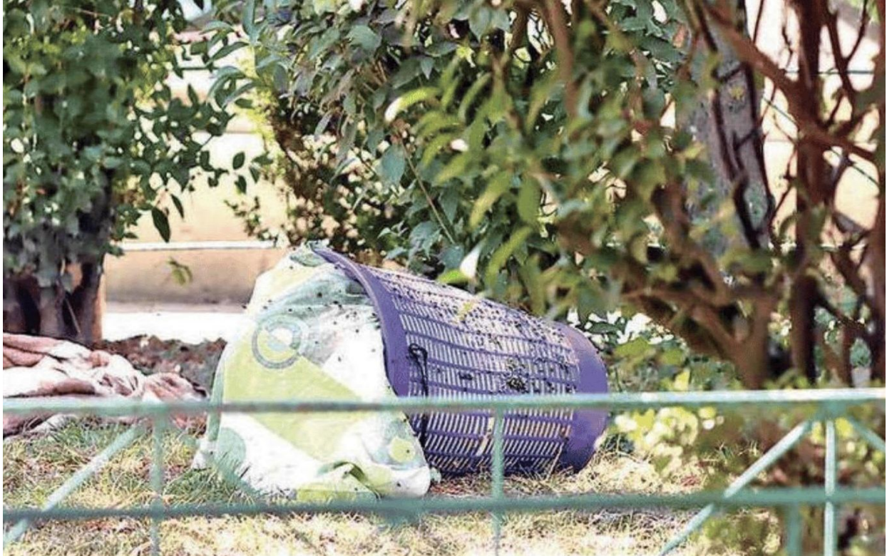
Encuentran a una persona sin vida dentro de un cesto de plástico; cerca del hallazgo había un hoyo cavado en la tierra