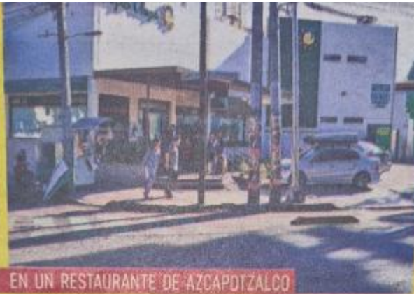
EN UN RESTAURANTE DE AZCAPOTZALCO