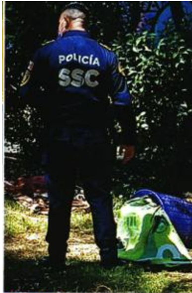
TLATELOLCO. Los restos humanos, supuestamente de una mujer, estaban envueltos en una bolsa dentro de un bote.