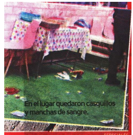
En el lugar quedaron casquillos y manchas de sangre.

A pesar de que fue detenido en dos ocasiones por la Fiscalía capitalina, las autoridades lo dejaron libre, por lo que se sentía impune al seguir delinquiendo.