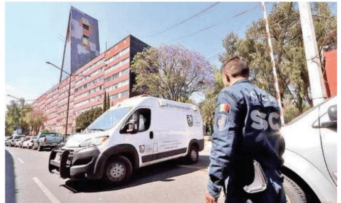
Los vecinos de Tlatelolco denuncian que la violencia en la zona es cada vez más común; exigen mayor vigilancia y mejor iluminación