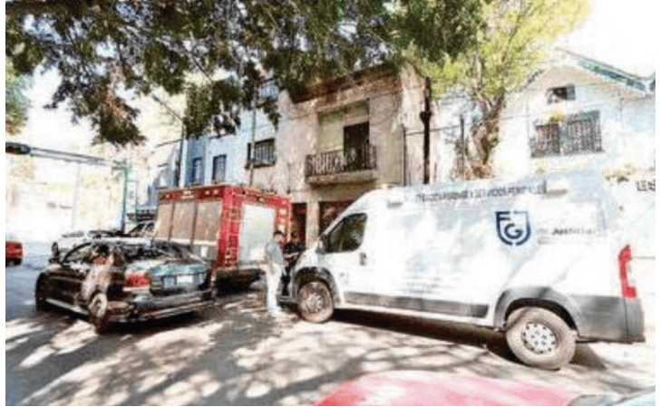
Vecinos alertaron a las autoridades luego de percibir un fuerte olor a putrefacción

Sin embargo, peritos realizaron el levantamiento del cuerpo y comenzaron las investigaciones correspondientes para esclarecer los hechos. Hasta el momento las autoridades se encontraban en busca de un familiar de la mujer de la tercera edad para saber si vivía sola o tenía alguna enfermedad que le causara la muerte.