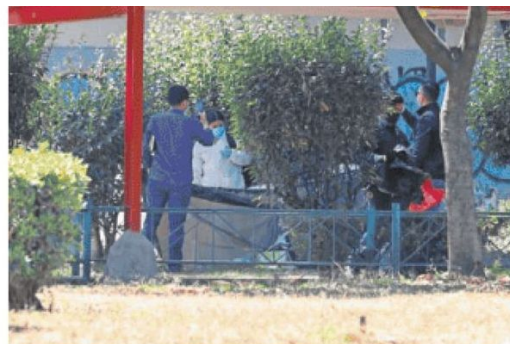
Al lugar de los hechos arribaron peritos de la fiscalía para realizar el levantamiento de los restos.

En tanto, se revisan cámaras de seguridad para dar con los responsables, pues según los vecinos, el tambo fue abandonado durante la madrugada. ●