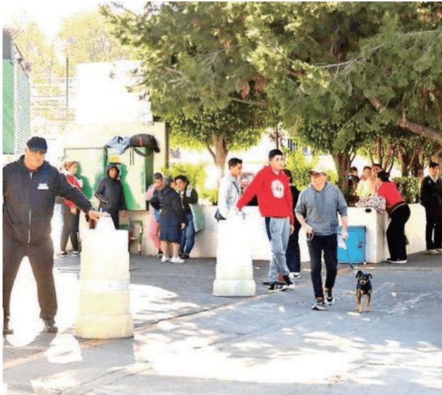
Misterioso deceso de un hombre en restaurante de Azcapotzalco; los comensales no entendían por qué no podían entrar