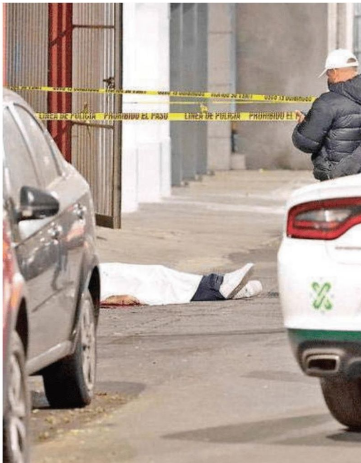
Ataque a una pareja en Santa María La Ribera dejó al hombre sin vida

La agresión fue al momento de la salida del hombre y la mujer del edificio donde vivían