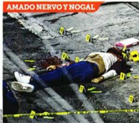
En torno al cuerpo de Jorge, de unos 30 años, quedaron al menos 18 indicios balísticos.