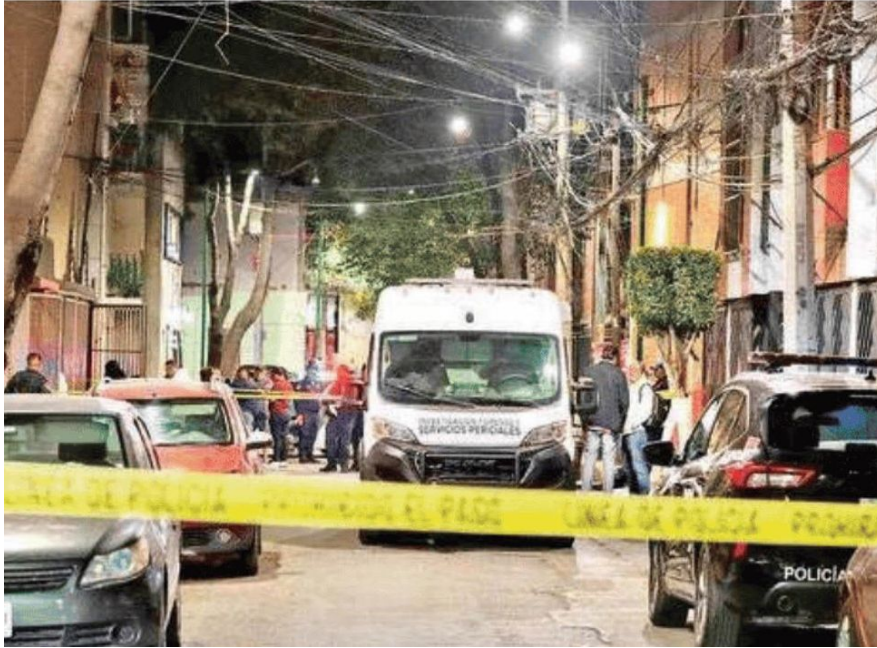
Vecinos de la Cuauhtémoc piden tanto a las autoridades de la demarcación como del gobierno central aumentar la vigilancia para evitar robos y homicidios