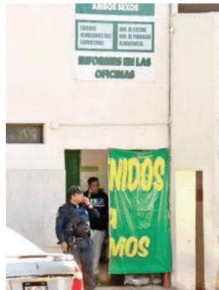
Localizan cadáver en el horno de pan; muy temprano ocurrió el hallazgo