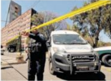
El cuerpo se hallaba en un parque de Tlatelolco