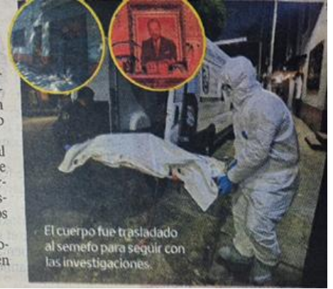
El cuerpo fue trasladado al semefo para seguir con las investigaciones.

"Fue muerte natural y es por protocolo", indicó uno de los policías en el lugar.