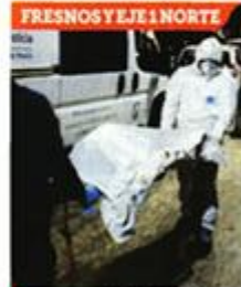
La mujer, de 80 años, habría muerto por causas naturales.

Vecinos de Calle Fresnos, casi en la esquina con Eje 1 Norte José Antonio Alzate, también en Santa María la