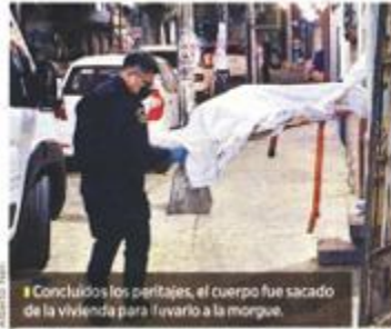
Concluidos los peritajes, el cuerpo fue sacado de la vivienda para llevarlo a la morgue.