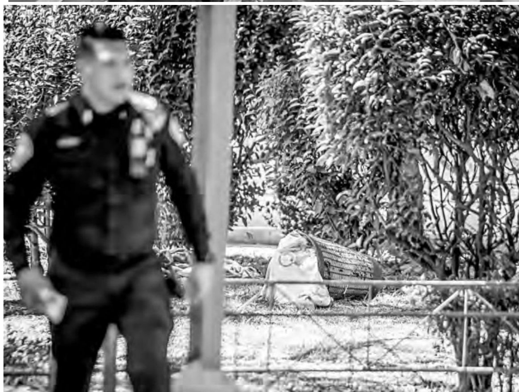
► Los habitantes de esa unidad habitacional reprocharon la falta de efectivos policíacos.