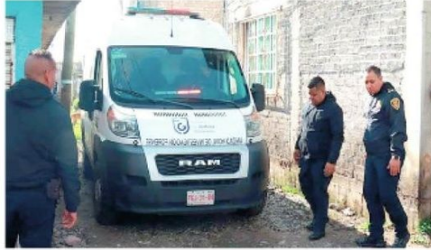
· La policía investiga el móvil

Aún se desconoce el motivo por el cual ultimaron de tal manera a la víctima.