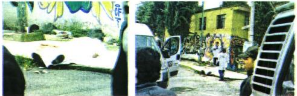
Los hechos se registraron en la calle Tenosique esquina con Yaxcaba, alcaldía Tlalpan

para comprar algo en el tianguis se detenían para ver al hombre, otros más sacaban su celular para tomar una foto.