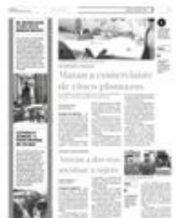
Su familia asegura que no había recibido amenazas