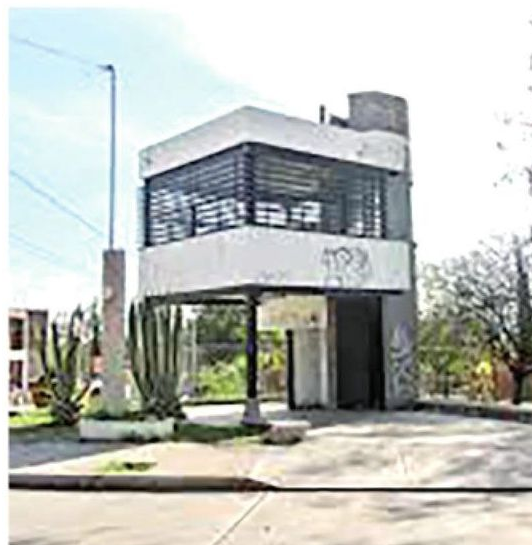
Están en un total olvido

Pese a que no se cuenta con un dato preciso de cuántos operan actualmente, de acuerdo con datos de la Secretaría de Seguridad Ciudadana, estos módulos funcionan las 24 horas del día y están conectados con el sector policiaco para que, sin embargo, la dependencia reveló que no se les asigna un presupuesto específico para su operación.