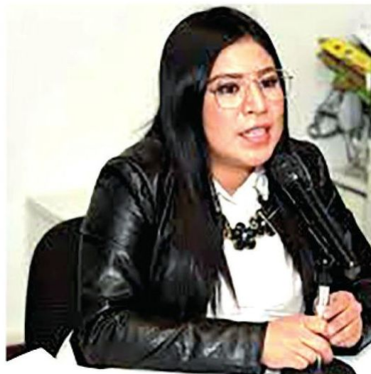
Anunció Paz políticas de seguridad

Los robos en transporte público y extorsiones incrementaron durante los últimos meses en Iztacalco