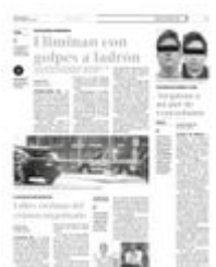
Fueron encontrados por cámaras de vigilancia