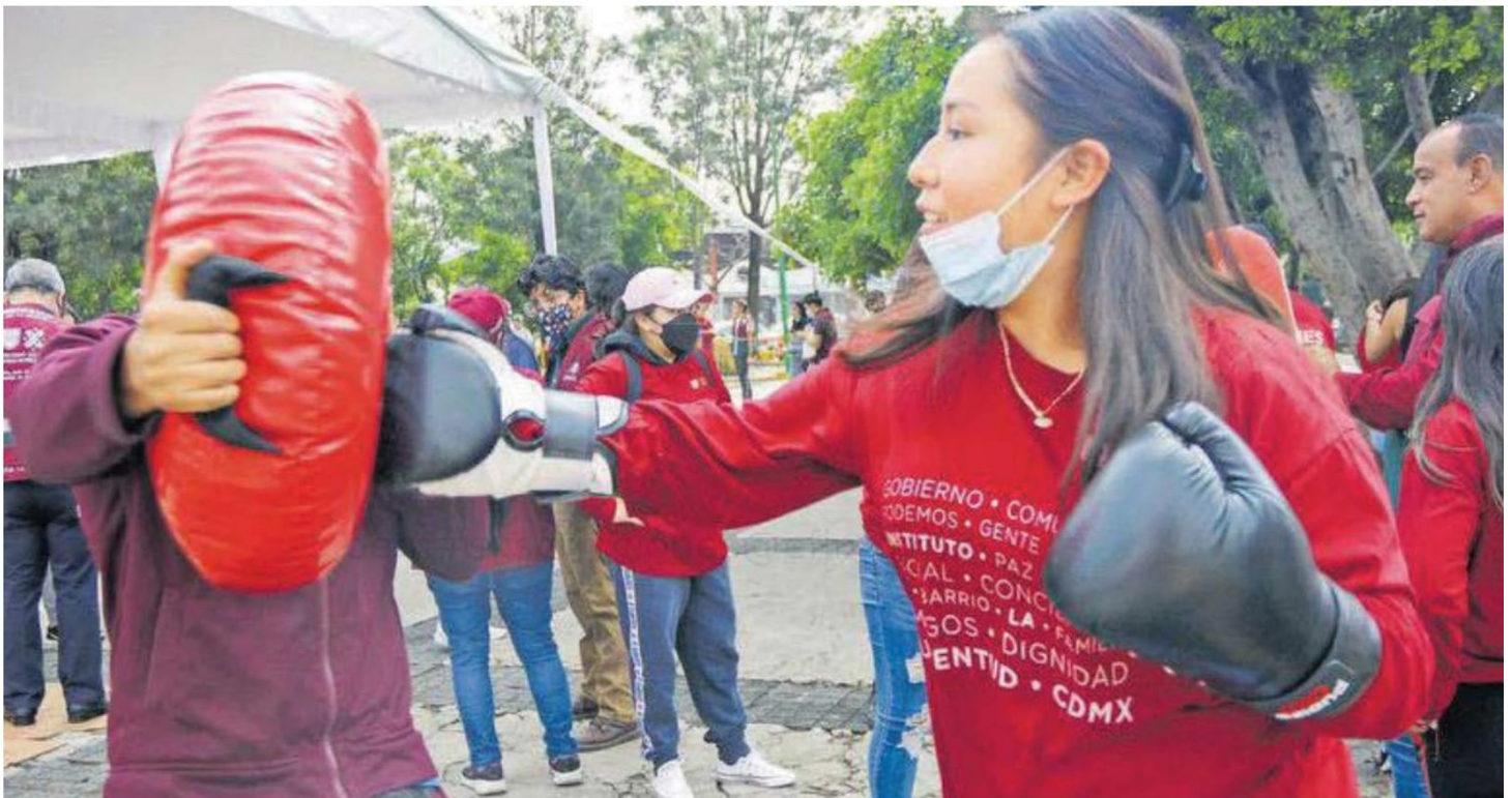
Impulsarán las actividades deportivas y recreativas entre los jóvenes.

AMBOS programas buscan atender el delito, restituir y garantizar los derechos humanos, además de mejorar el entorno urbano