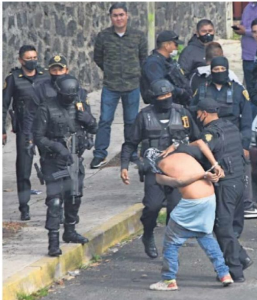
En la CDMX, donde al CJNG le han descubierto operaciones financieras, se han desarticulado células.