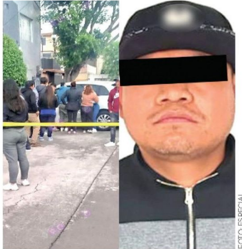
Poco le duró el gusto al homicida

Por lo anterior, el delincuente, de 32 años, fue llevado al MP, quien definirá su situación jurídica.