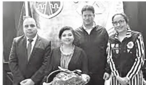
Consolidó a su equipo en la SSC

Anunció un aumento salarial del 63% para los policías