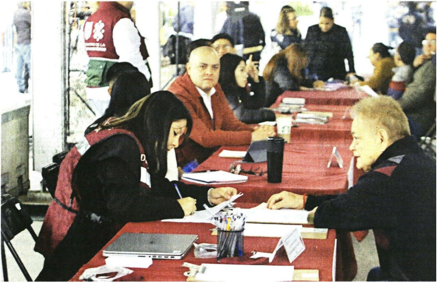
EN DIÁLOGO. Secretarios se reunirán con ciudadanos todos los martes en la Plaza de la Constitución.