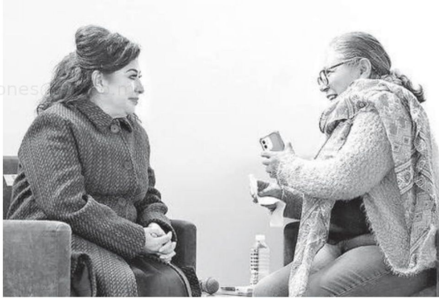
La jefa de Gobierno confirmó el acercamiento del gobierno con los ciudadanos por medio de este servicio al pueblo