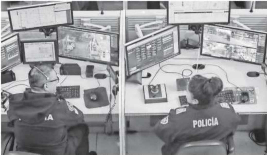
La pasada administración cerró con 80 mil cámaras instaladas y manejadas por el C5