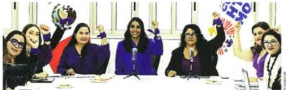
Funcionarias de la Alcaldía, activistas y representantes de organizaciones conforman el órgano.

cluirá todas las áreas de la Alcaldía. Se reunirá periódicamente para analizar transversalmente el avance en las políticas públicas dirigidas a construir un hábitat libre de violencia”, destacó una de las integrantes.