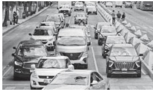
La policía educará sobre seguridad vial