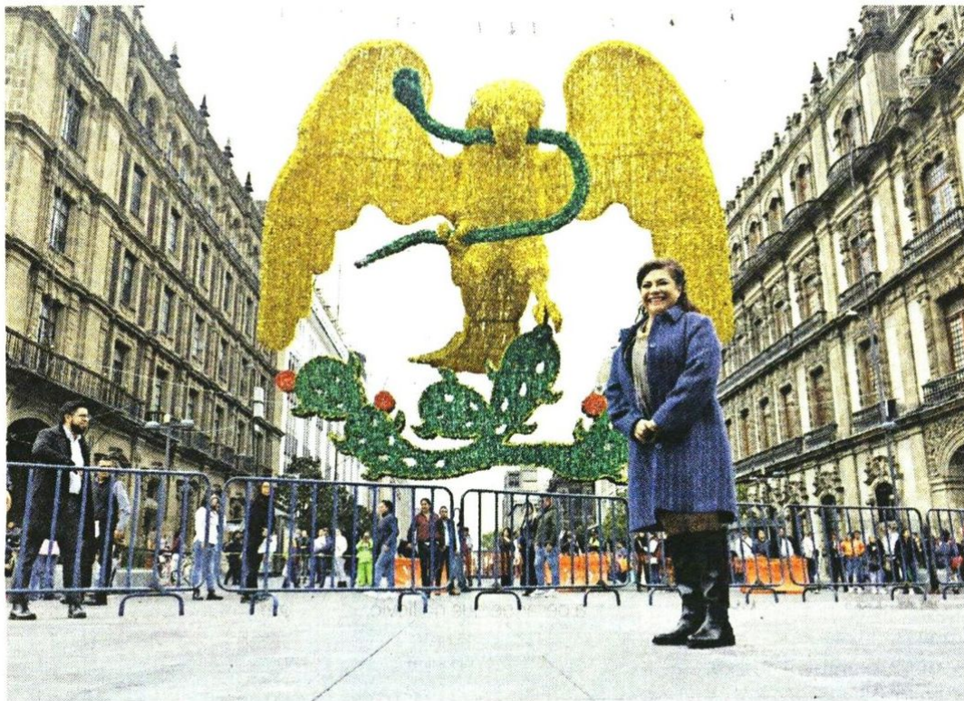
■ La Jefa de Gobierno, Clara Brugada, también atenderá temas prioritarios y aseguró que las audiencias servirán para analizar las peticiones ciudadanas y convertirlas en programas.