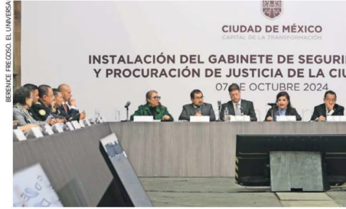
En el gabinete de seguridad de la CDMX, la jefa de Gobierno, Clara Brugada, destacó la utilización de la plataforma de Visor 360.