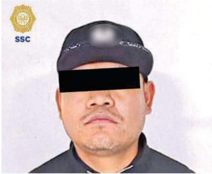
El detenido presuntamente está relacionado con las agresiones por arma de fuego contra un hombre