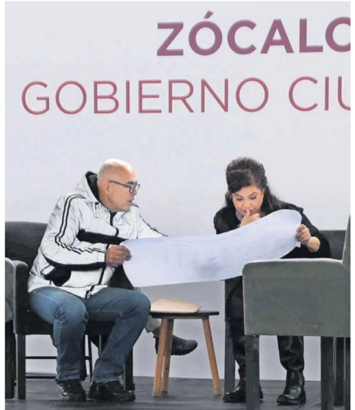
Desde las 09:00 y hasta las 15:00 horas, los integrantes del gabinete local atendieron a los ciudadanos; el acto lo encabezó la jefa de Gobierno.