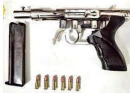
A uno de los implicados le hallaron un arma de fuego corta, un cargador y seis cartuchos útiles

edad ingresaron a un hospital lesionados por disparo de arma de fuego, uno a la altura de la cadera y otro en el abdomen, quienes refirieron que los hechos ocurrieron en la calle Herreros a la altura de Tapicería.