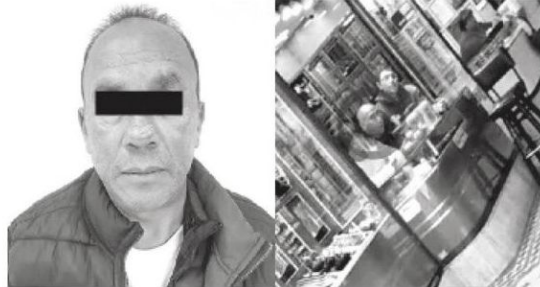
·Revendía los robado en joyerías donde laboraba

Fue así que los uniformados, al realizar recorridos de seguridad y vigilancia en la avenida Insurgentes Norte, de la colonia Residencial Zacatenco, ubicaron a un sujeto que coincidía con las características del posiiimplicado.