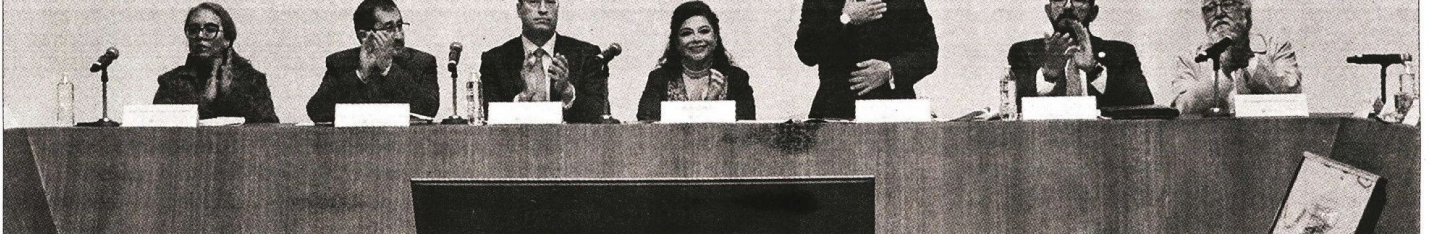
En su discurso , el magistrado Rafael Guerra Álvarez, afirmó que el PJCDMX se suma al reconocimiento del esfuerzo histórico y fructífero que encabezan las fuerzas policiales, distinguidas por su lealtad a la patria y sentido del honor.