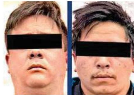
Los detenidos junto con el vehículo y lo asegurado, fueron presentados ante el agente del MP

con dos eventos, el primero por Robo a comensales ocurrido el pasado 27 de septiembre en la alcaldía Miguel Hidalgo; y el segundo por Robo con violencia, el pasado 28 de septiembre, en el Edomex.