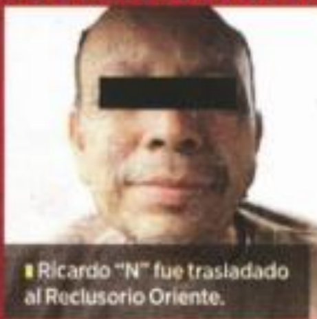
■ Ricardo "N" fue trasladado al Reclusorio Oriente.

Tras ser dado de alta, el sujeto fue detenido por agentes