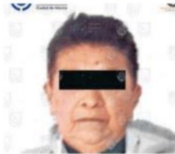
El ilícito ocurrió en 2023 en un domicilio ubicado en Azcapotzalco /CORTESIA FGJ CDMX.

Trabajos de gabinete y campo realizados por los agentes de la PDI, adscritos a la Dirección General de Atención y Cumplimiento de Ordenamientos Judiciales, permitieron aprehenderla