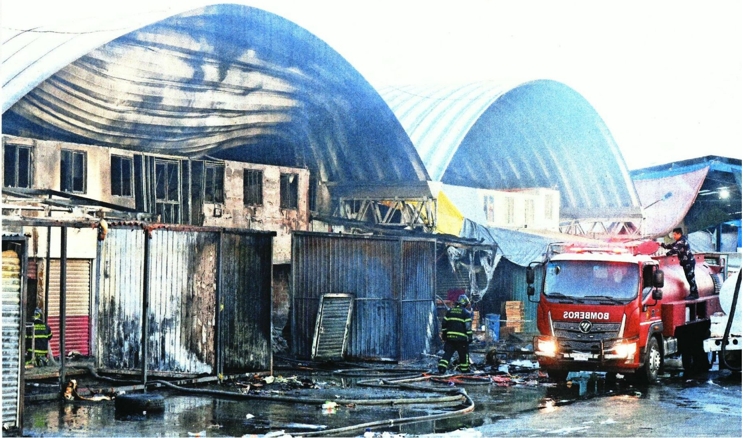
Elementos del Heroico Cuerpo de Bomberos, de la SSC, de la Unidad de Gestión Integral de Riesgos de la alcaldía, de la Ceda y de la SGIRPC controlaron las llamas.