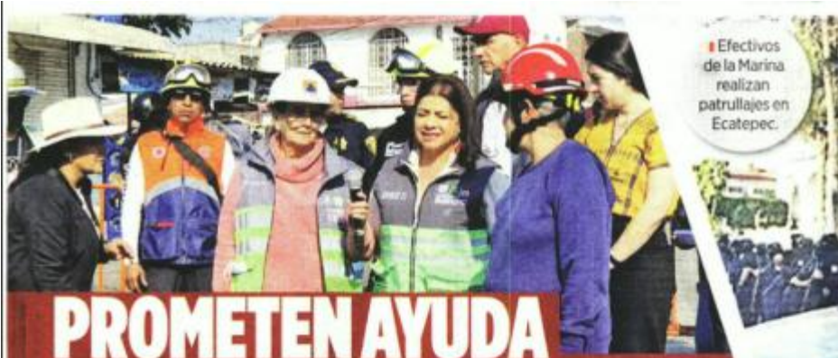
■ Efectivos de la Marina realizan patrullajes en Ecatepec.