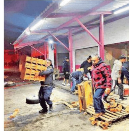
Locatarios lamentaron pérdidas de mercancía y solicitaron apoyo del Gobierno Federal, así como del capitalino