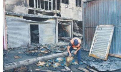
El fuego se dio en las naves 1 y 4 de la Central de Abasto.

En estrecha coordinación, para el control y extinción del fuego, participaron 700 elementos, entre cuerpos de emergencia, distintas dependencias del Gobierno de la CDMX y de la Central de Abasto, por lo cual la CEDA realiza sus actividades de forma habitual. ●