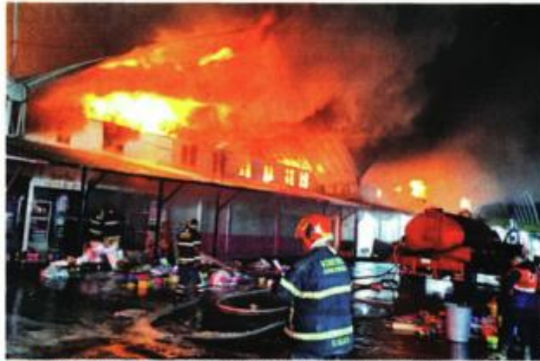
CORAZONES ROTOS. El incendio se registró en la víspera de la venta por el 14 de febrero.