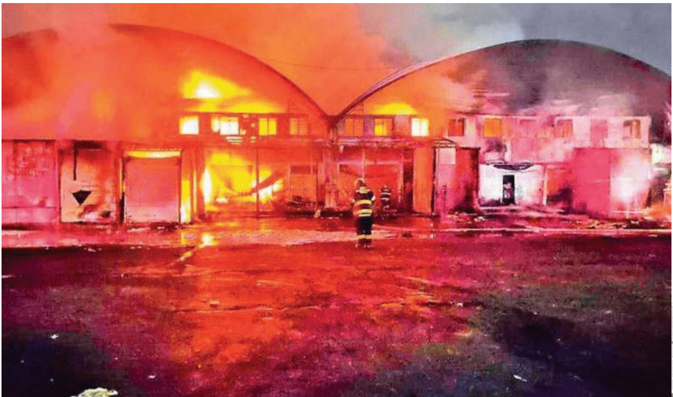
El incendio en la Central de Abasto consumió al menos dos naves del mercado de Flores y Hortalizas

Por más de cuatro horas los bomberos realizaron labores para controlar el fuego, mientras que elementos del Ejército Mexicano resguardaron toda la zona