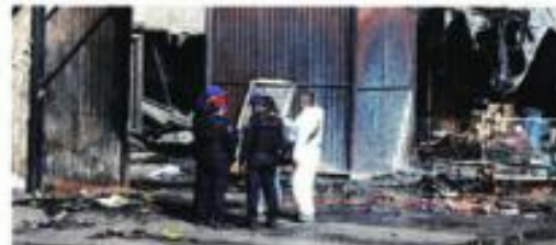
Por más de tres horas bomberos batallaron con las llamas, se requirieron unas 30 pipas de agua para sofocarlas.

tan con el Gobierno de la Ciudad para rehabilitar, para brindar apoyo a los afectados", expresó.