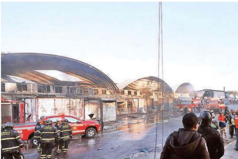
Hace ocho años se quemó la misma área y hace 12 también sucedió lo mismo, así lo indicaron locatarios del área de Legumbres