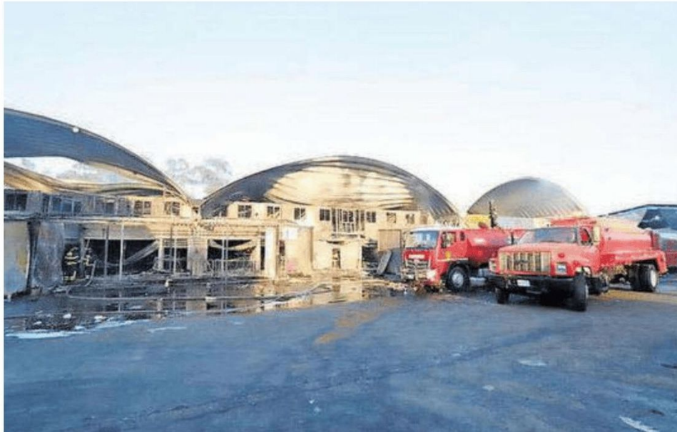
La madrugada del domingo ocurrió un incendio en la Central de Abasto.