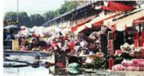
Locatarios trataron de rescatar sus mercancías, pero el paso del fuego era evidente en el área de Flores y Hortalizas.

"Vine a decir que este mercado, la parte que fue afectada, se tiene que poner de pie de inmediato y cuen-