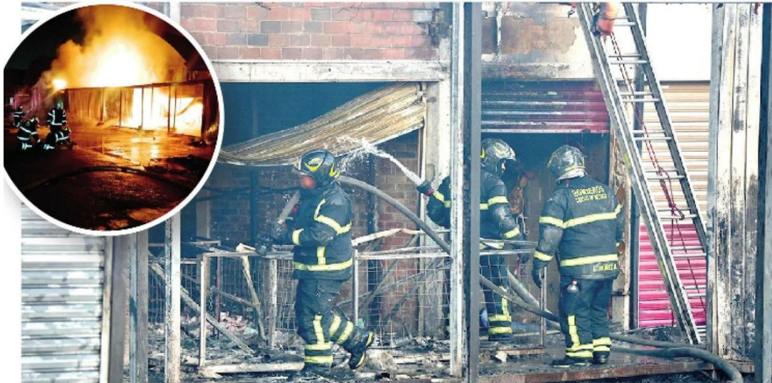
Bomberos lucharon durante 4 horas contra las llamas