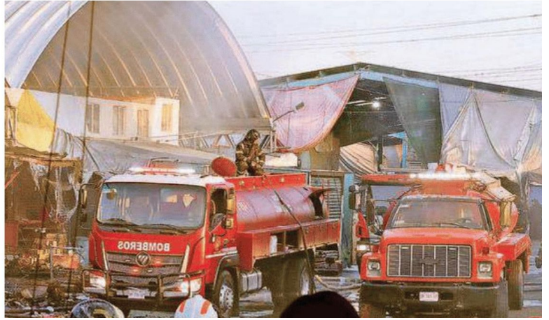
Elementos de la Secretaría de Aguas de la Ciudad de México activaron dos garzas, tres pipas y una cisterna