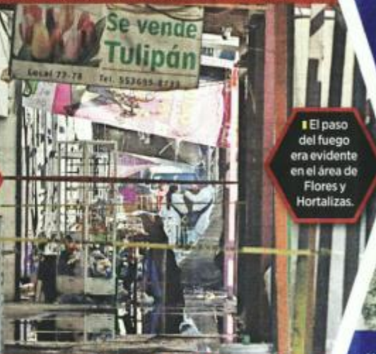
■ El paso del fuego era evidente en el área de Flores y Hortalizas.

50 personas FUERON EVACUADAS DE LA ZONA SINIESTRADA