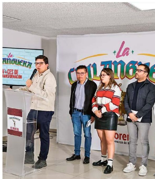
LUGAR. Diputados locales del Movimiento de Regeneración Nacional participarán en las cinco mesas de trabajo que iniciarán en el Congreso capitalino.

de febrero se realizará el primer foro “Rumbo a la Actualización de la Ley de Coordinación Metropolitana”