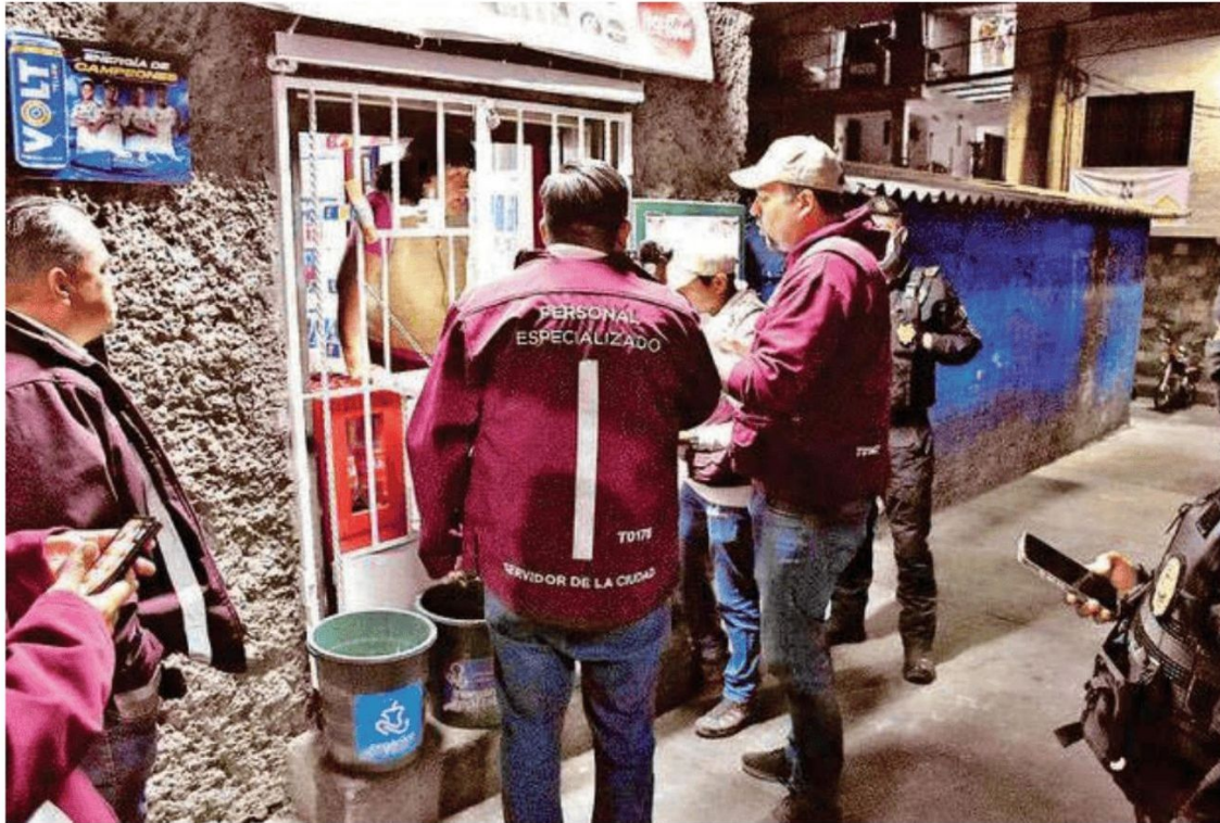
El operativo se llevó a cabo a en las alcaldías: Cuauhtémoc, Venustiano Carranza, Iztapalapa y Tlalpan