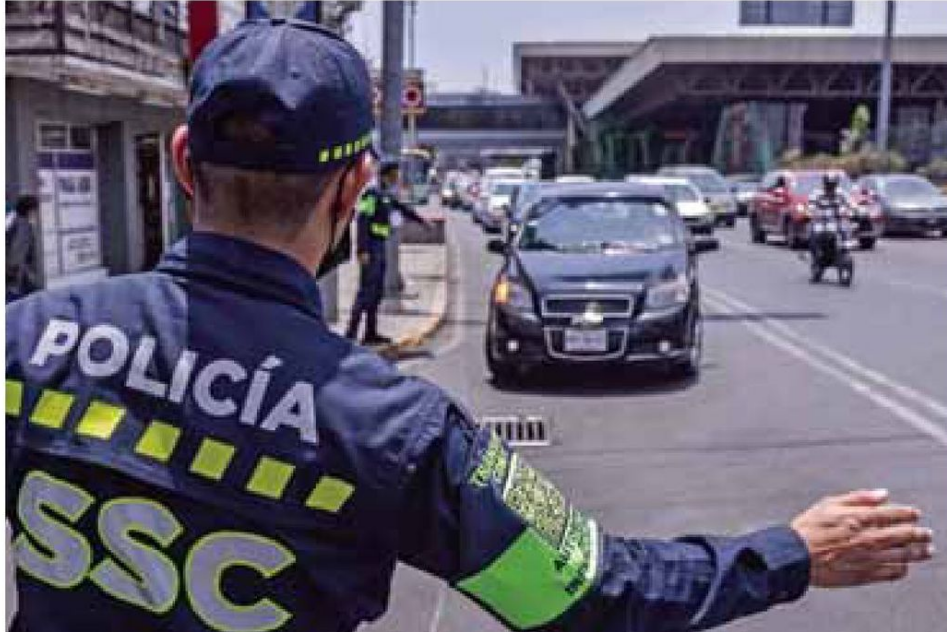
Foráneos. Los vehículos emplacados en estados ajenos a la CDMX suelen cometer más infracciones relacionadas a la velocidad.