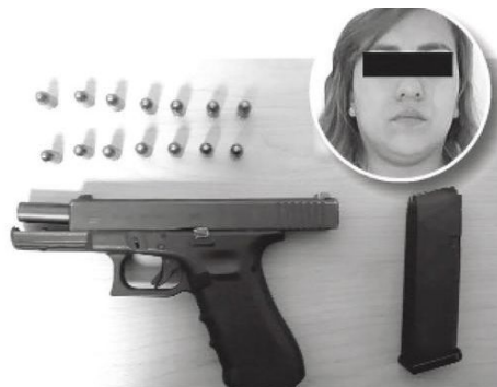
Resultó de armas tomar

La detenida, de 30 años de edad, fue informada de sus derechos constitucionales y, junto con lo asegurado, puesta a disposición del agente del Ministerio Público, quien determinará su situación jurídica.