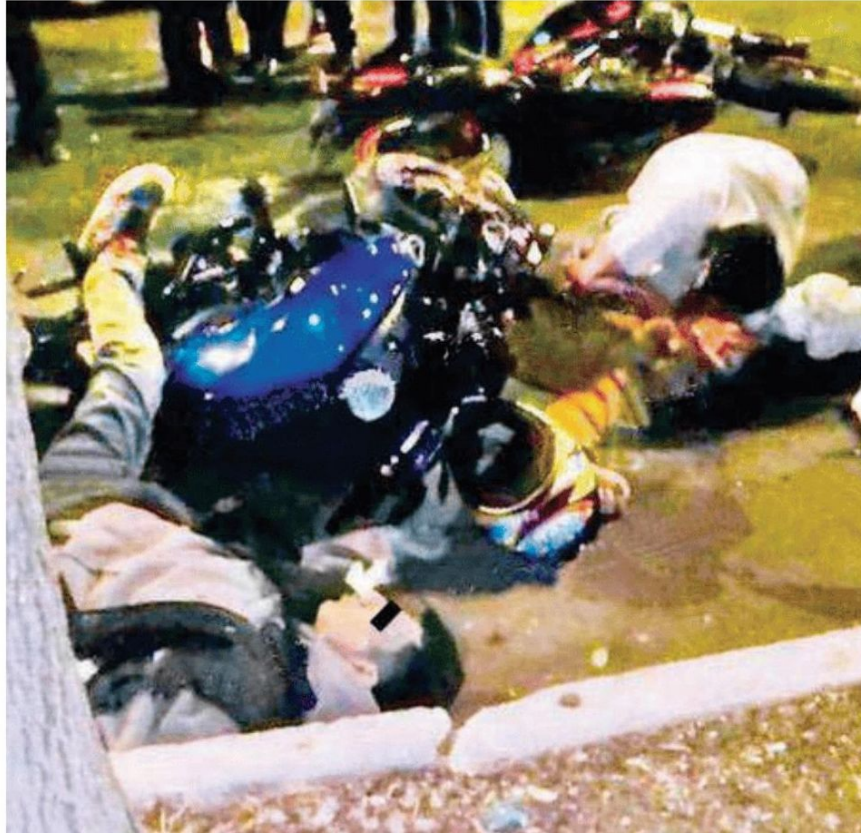
Familiares de los occisos llegaron hasta el lugar para llorar la muerte de los jóvenes, quienes quedaron sobre el asfalto junto a sus motocicletas