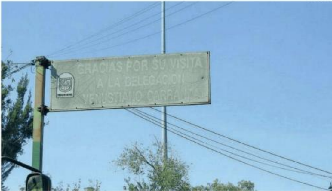
Muchas placas existentes están deterioradas o ilegibles debido a la exposición prolongada al clima, el desgaste o actos de vandalismo.