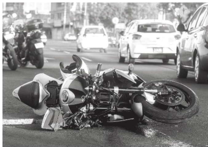
Acapalaron el 43% de las 148 muertes registradas el año pasado

Del total de los motociclistas fallecidos, 66 lo hicieron por choque, 51 por derrape y uno fue atropellado