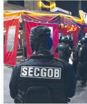
DESPLIEGUE. Este fin de semana se llevó a cabo un operativo en cinco alcaldías por venta ilegal de alcohol.

Asimismo, se aprehendieron a dos personas por quebrantamiento de sellos de clausura, mismas que fueron remitidas ante el Ministerio Público. /ÁNGEL ORTIZ