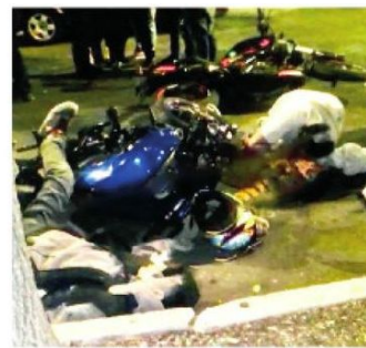
Lo sorprendió la muerte

Oficiales de la SSC implementaron un operativo virtual para buscar a los responsables del doble asesinato.