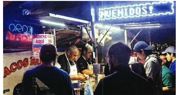
La taquería busca reabrir tras haber recibido la amenaza.

Apuntó que ninguno dijo ser víctima de extorsión presencial. Incluso, descartó que los encargados de Ruben's hayan denunciado.