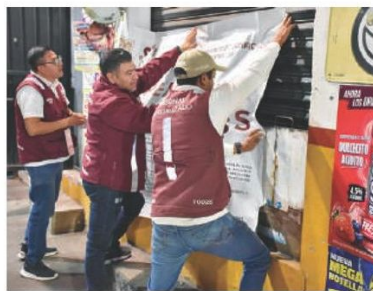
PERSONAL del Gobierno capitalino al suspender una chelería.

Los operativos de las autoridades concluyeron con saldo blanco, pero hubo dos detenidos por el quebrantamiento de sellos de clausura, por lo que fueron remitidas ante el Ministerio Público, quien definirá su situación jurídica.