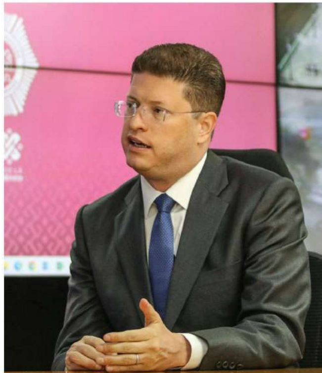
El jefe de la Policía capitalina

El funcionario policial comenta que aún existen retos en materia de violencia en la ciudad y mucho trabajo por hacer. No obstante, y respecto del proceso electoral hay un punto en el que hace mucho énfasis: "No va a haber ningún problema en el día de la elección. No va a haber ningún problema a lo largo del proceso electoral. No lo ha habido esencialmente. Y vamos a continuar sobre esa línea. Nosotros trabajamos de manera coordinada con los institutos electorales, el local y el nacional".