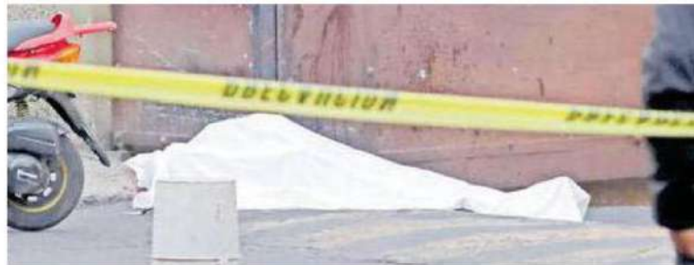
Autoridades investigan si fue un ajuste de cuentas

Una señora de aproximadamente 60 años dijo "el estaba viviendo aquí temporalmente porque le estaban arreglando su casa, pero ojalá que no suelten a esos infelices"