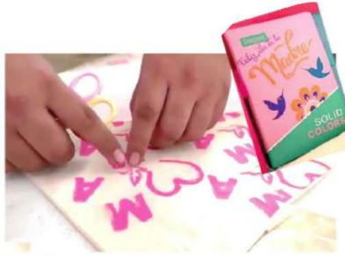
Los elaboraron con sus propias manos