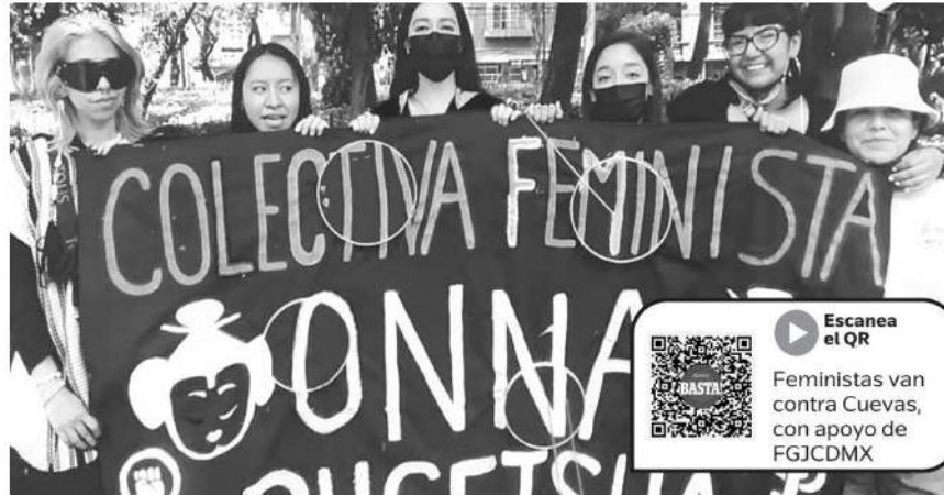
Feministas interpusieron acciones legales por haber sido agredidas físicamente