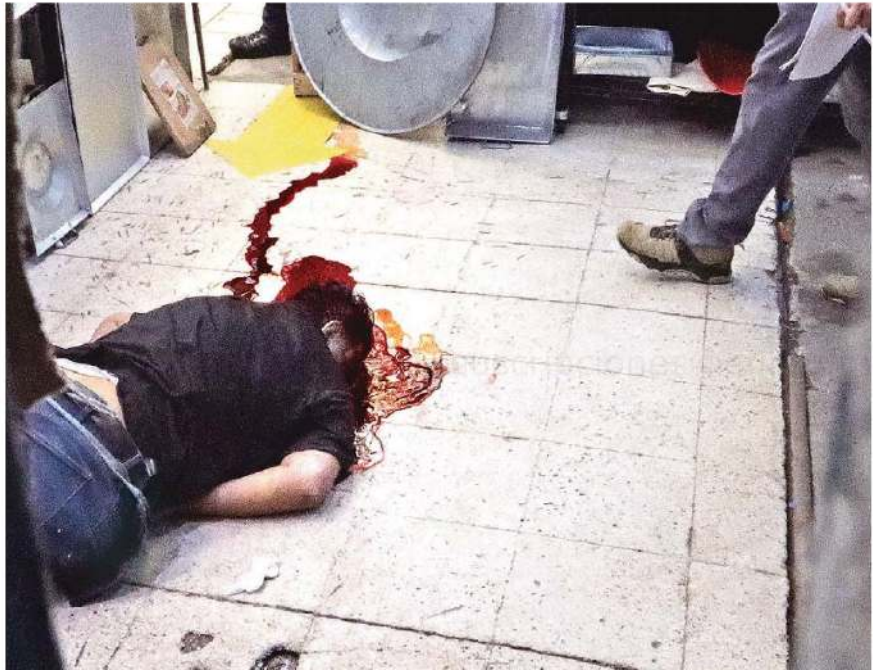
El hombre, de unos 45 años de edad, escogió la puerta falsa

Más tarde se informó que al parecer el hombre de unos 45 años de edad se había quitado la vida con disparo en la cabeza tras tener problemas con su esposa. Tras confirmar la muerte se dio aviso a la Fiscalía General de Justicia de la Ciudad de México (FGJCDMX), por lo que peritos llegaron hasta el Mercado de La Merced para realizar el levantamiento del cuerpo y trasladarlo a las instalaciones del Servicio Médico Forense (Semefo), también abrieron la respectiva carpeta de investigación por este hecho.