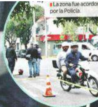
La zona fue acordonada por la Policía.