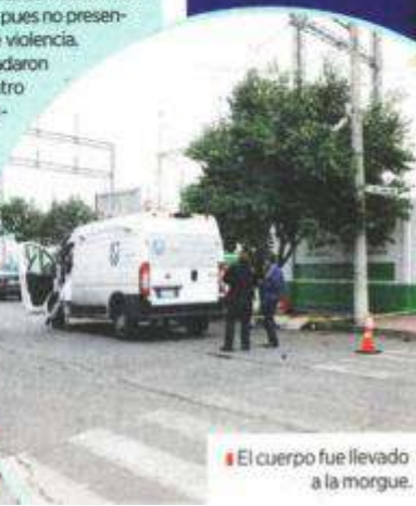
El cuerpo fue llevado a la morgue.