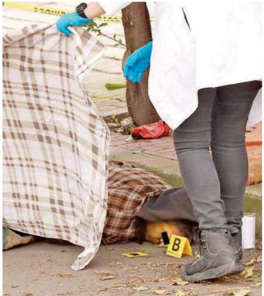
Los paramédicos nada pudieron hacer por El Flaco , quien había perdido los signos vitales, al parecer, a causa del frío

Nadie lloró el deceso de El Flaco , cuando llegaron los servicios periciales, quienes se encargaron del levantamiento del cuerpo, para trasladarlo al anfiteatro local y, de no ser reclamado en las siguientes horas, será llevado a la fosa común.