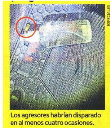
Los agresores habrían disparado en al menos cuatro ocasiones.

Cabe destacar que durante las primeras investigaciones, se reveló que la víctima había estado preso en un reclusorio de la CDMX, aunque no se detalló el delito que cometió. Redacción