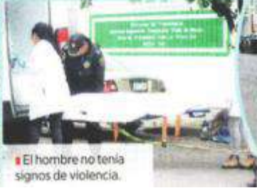
El hombre no tenía signos de violencia.