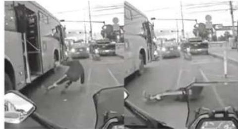
Momento exacto en que lo aventaron

Finalmente, no se confirmó si el asaltante fue detenido o si las autoridades de la Secretaría de Seguridad Ciudadana de la Ciudad de México (SSC) ya tienen información sobre su paradero para proceder a su captura, pues se presume que cometió otros atracos.