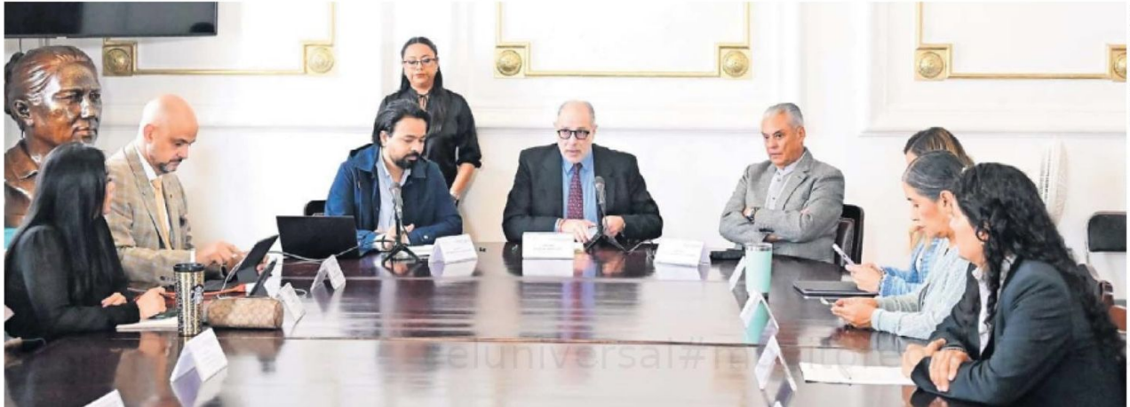
Consejo Judicial enviará la terna a la jefa de Gobierno, Clara Brugada, quien elegirá a uno o la enviará al Congreso de CDMX.